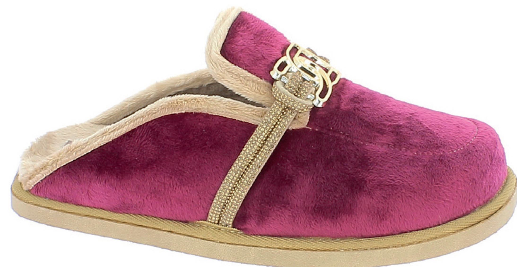
EDDA COD. 502