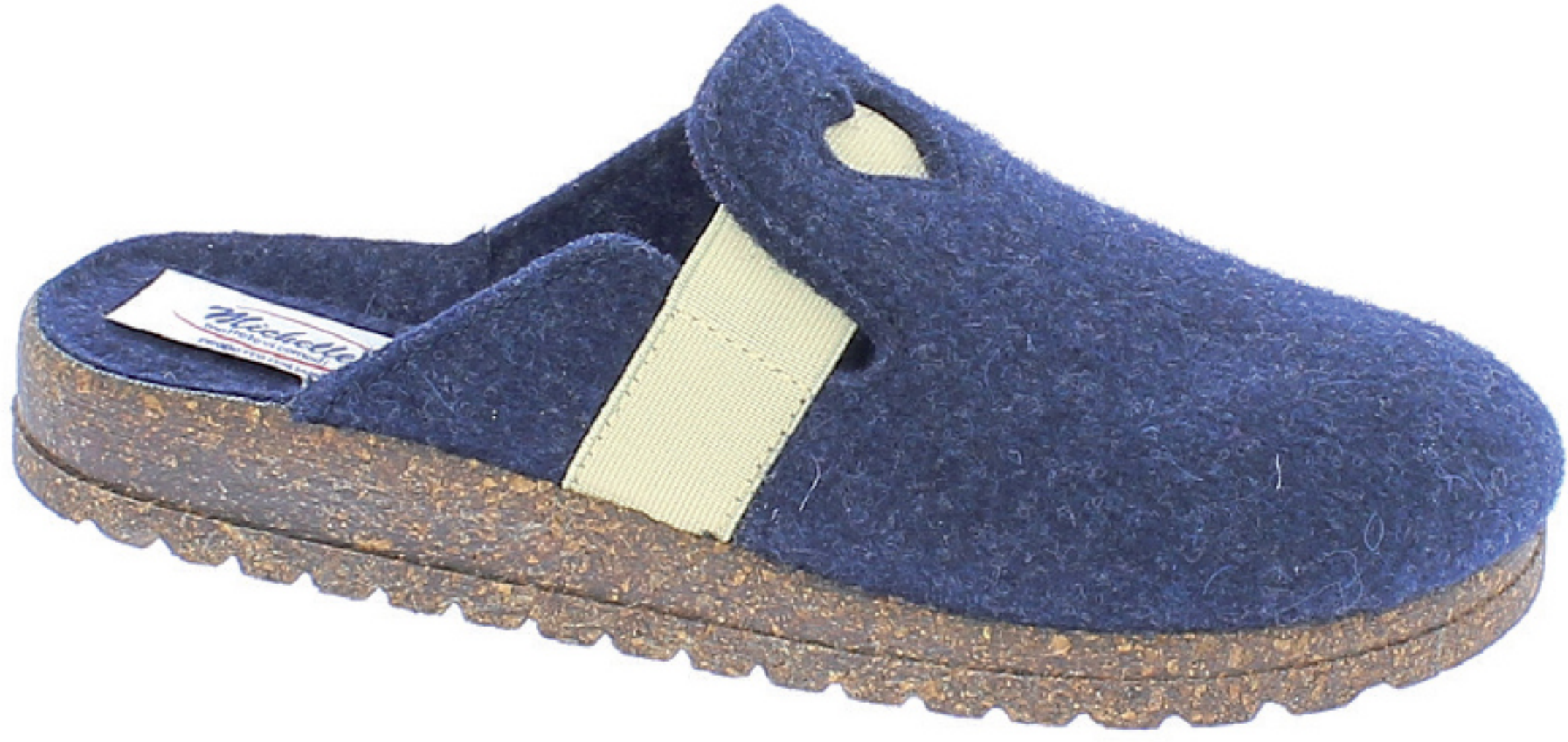
BRASILIA COD. 563