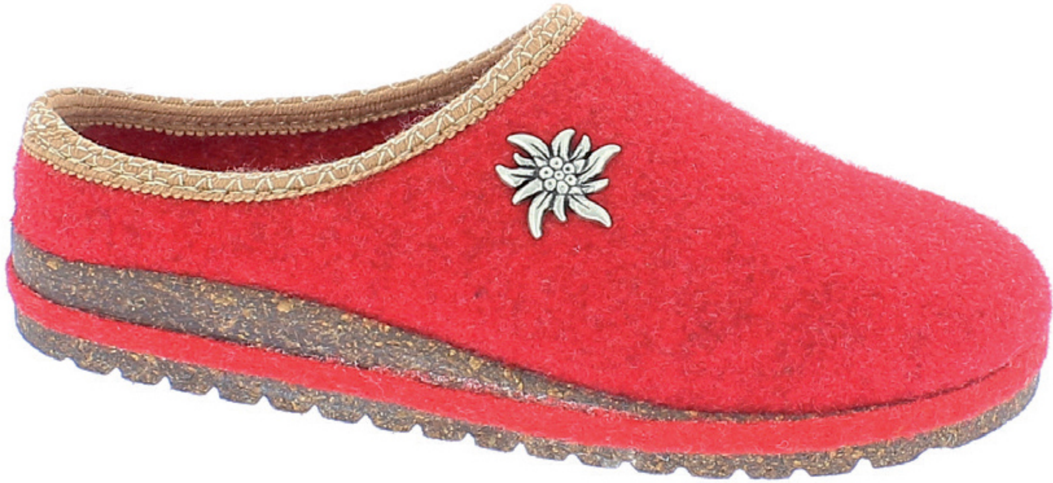
BRASILIA COD. 555