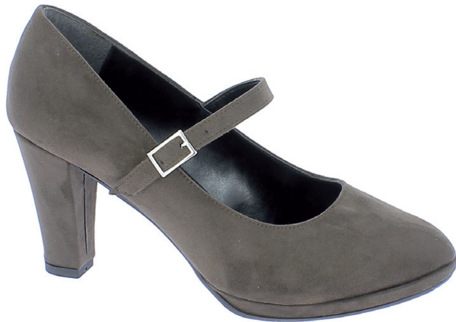
TEMI COD. 501