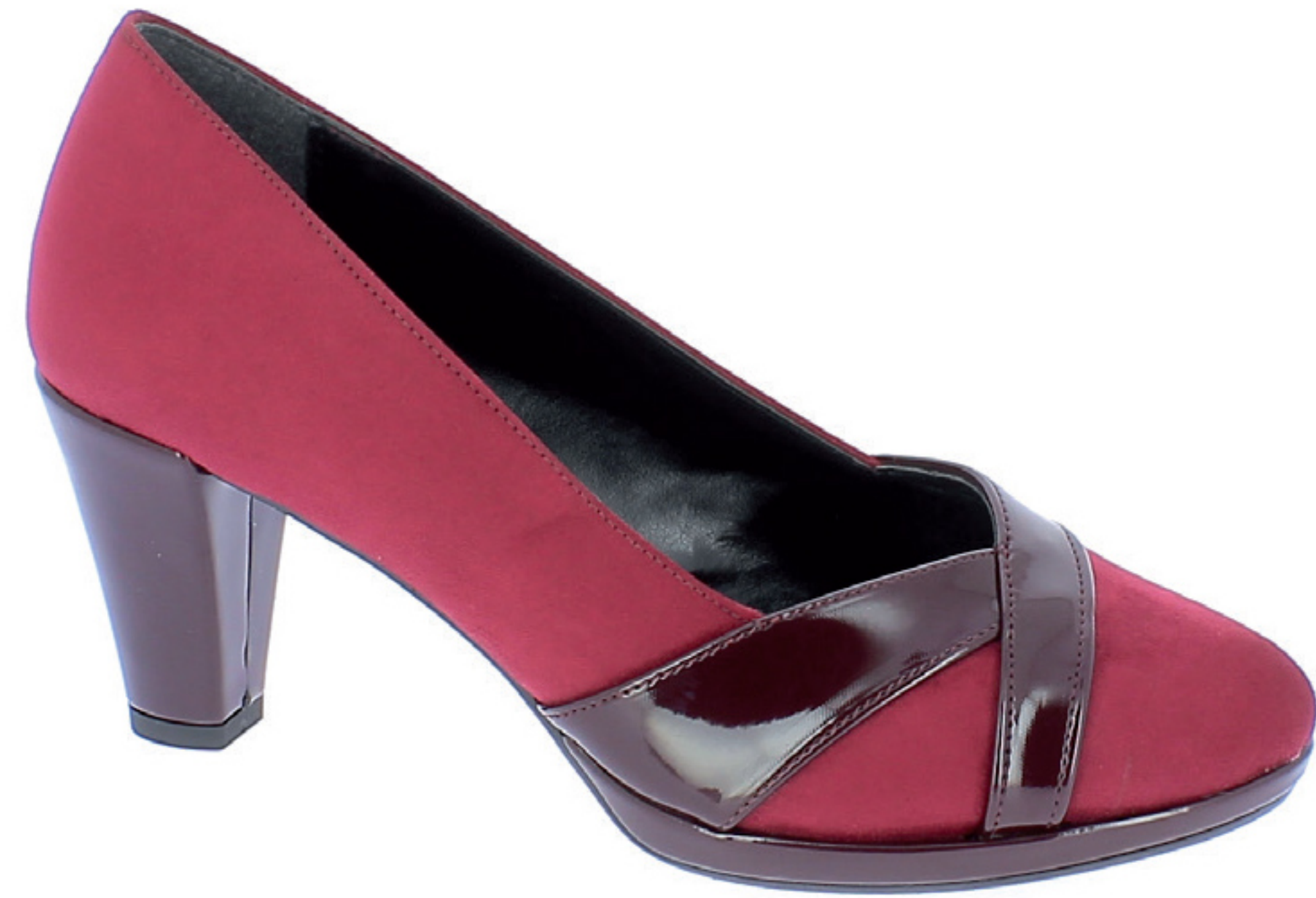
TEA COD. 501