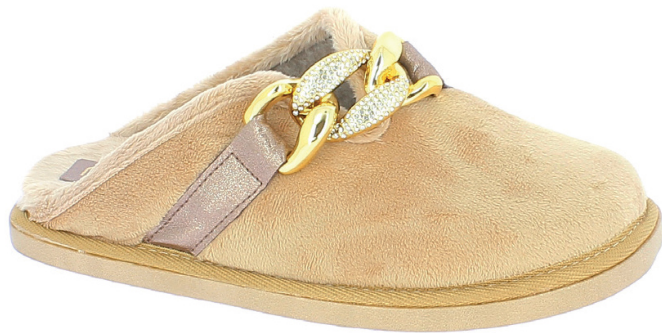
EDDA COD. 503