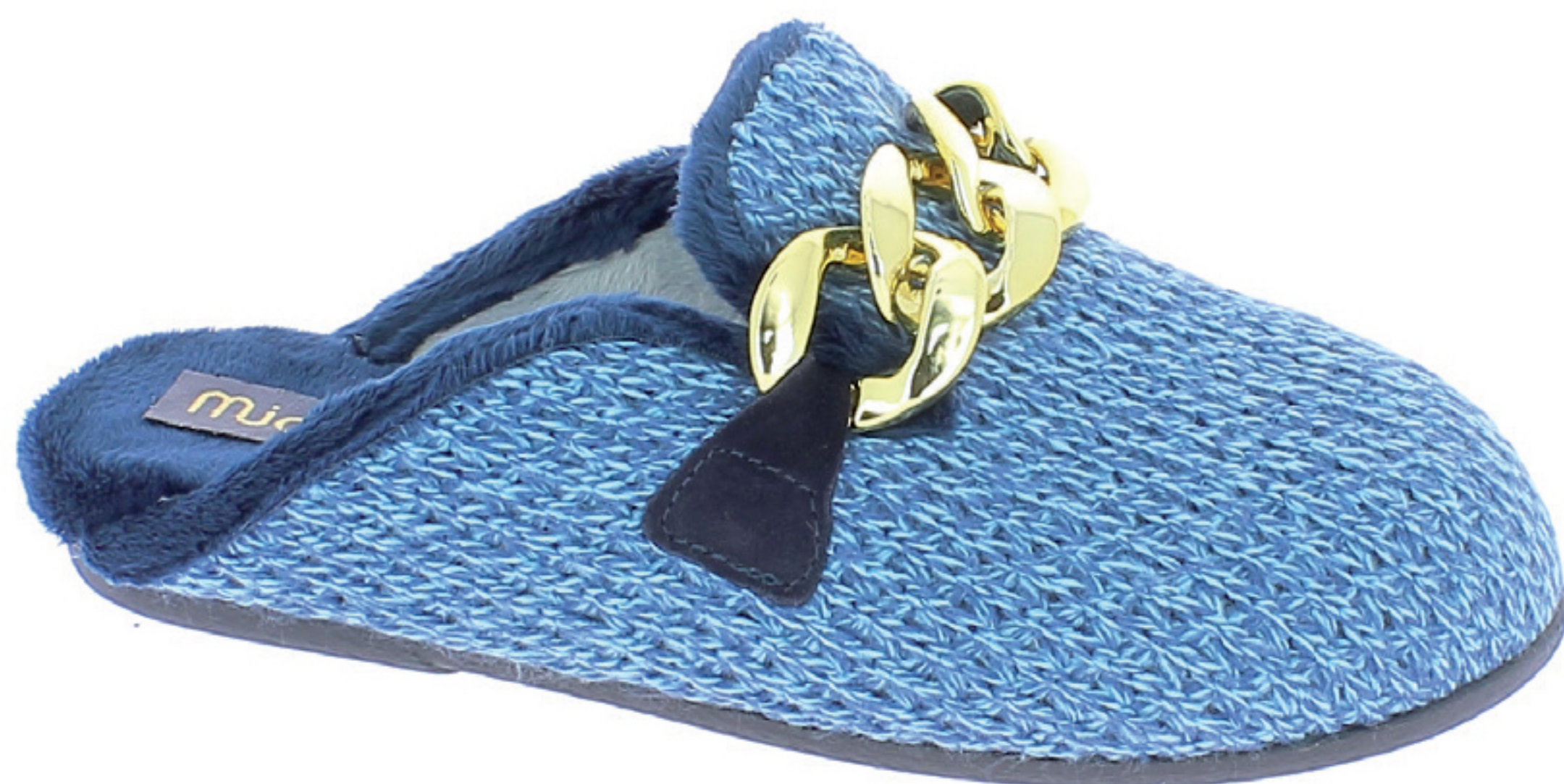
BETTA COD. 503