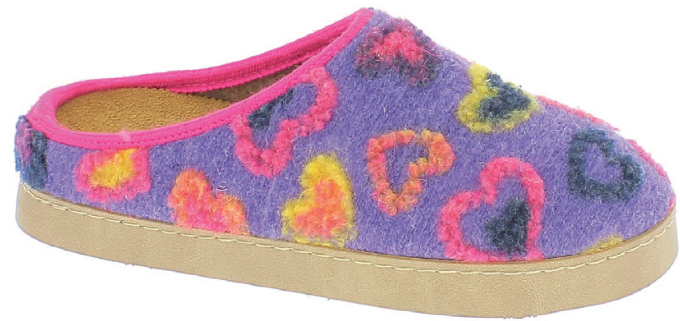
CAMILLA COD. 502