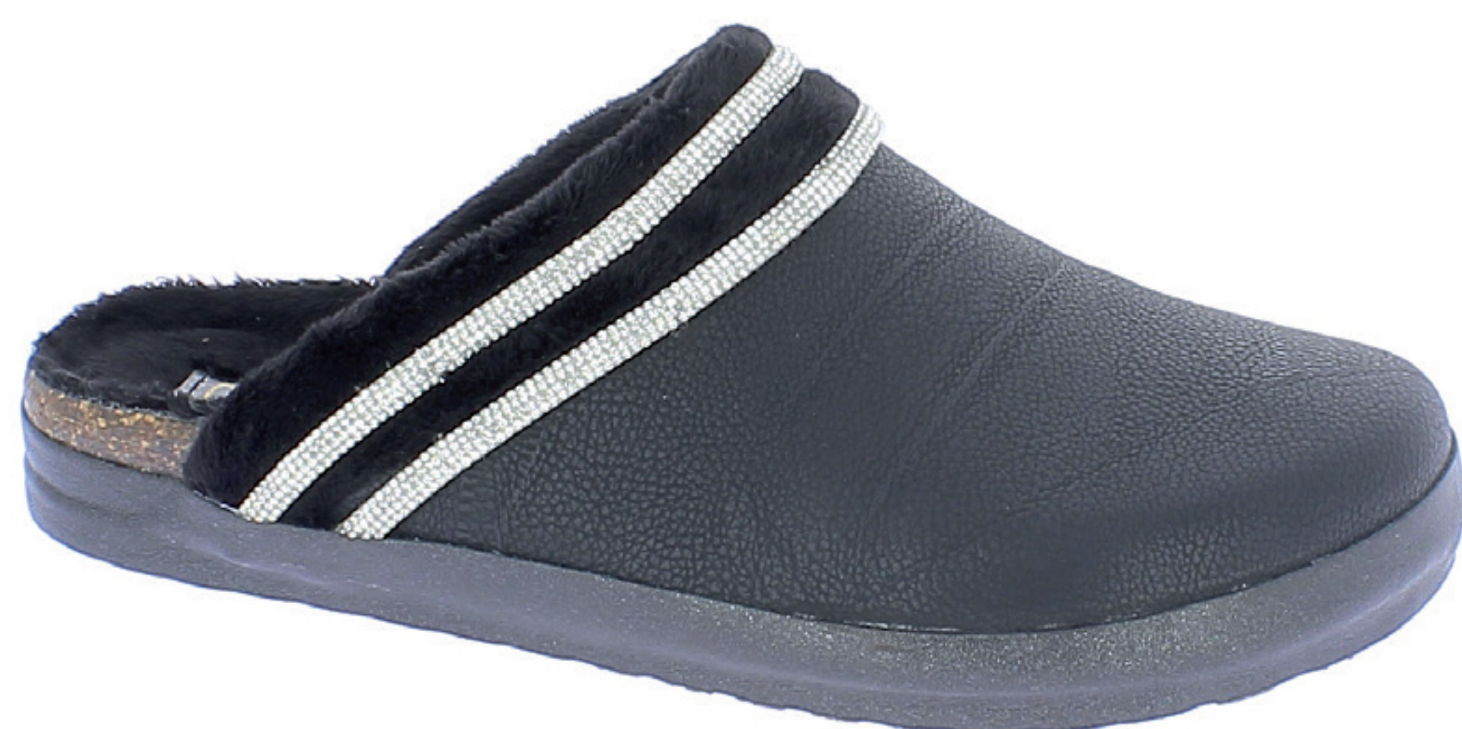
TERESA COD. 501