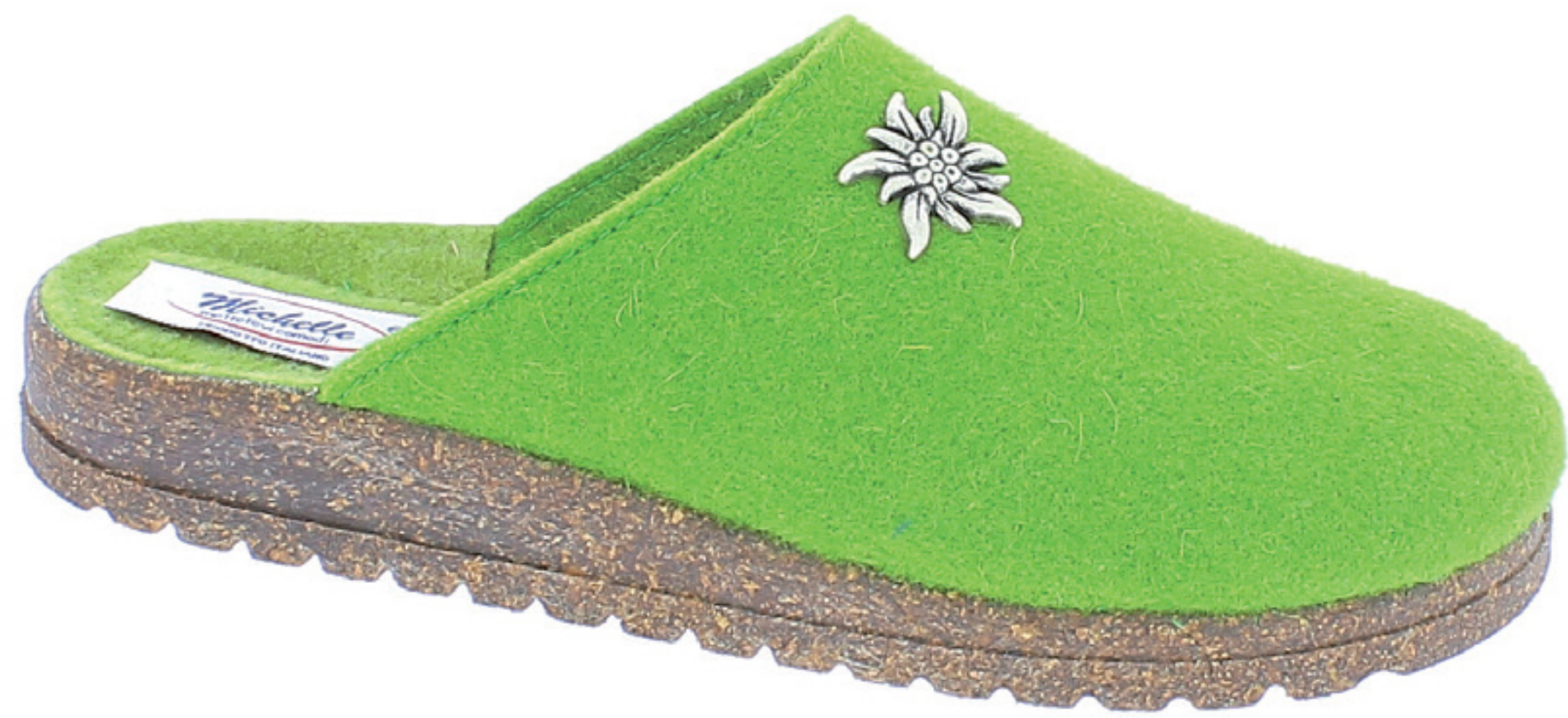
BRASILIA COD. 565