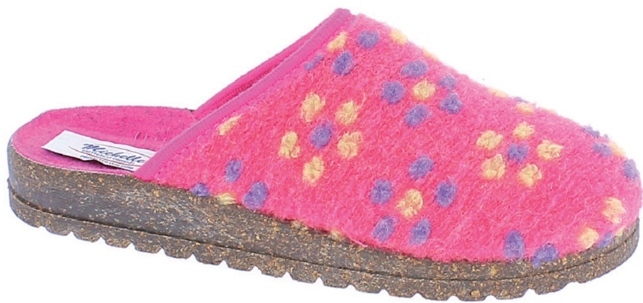
BRASILIA COD. 570