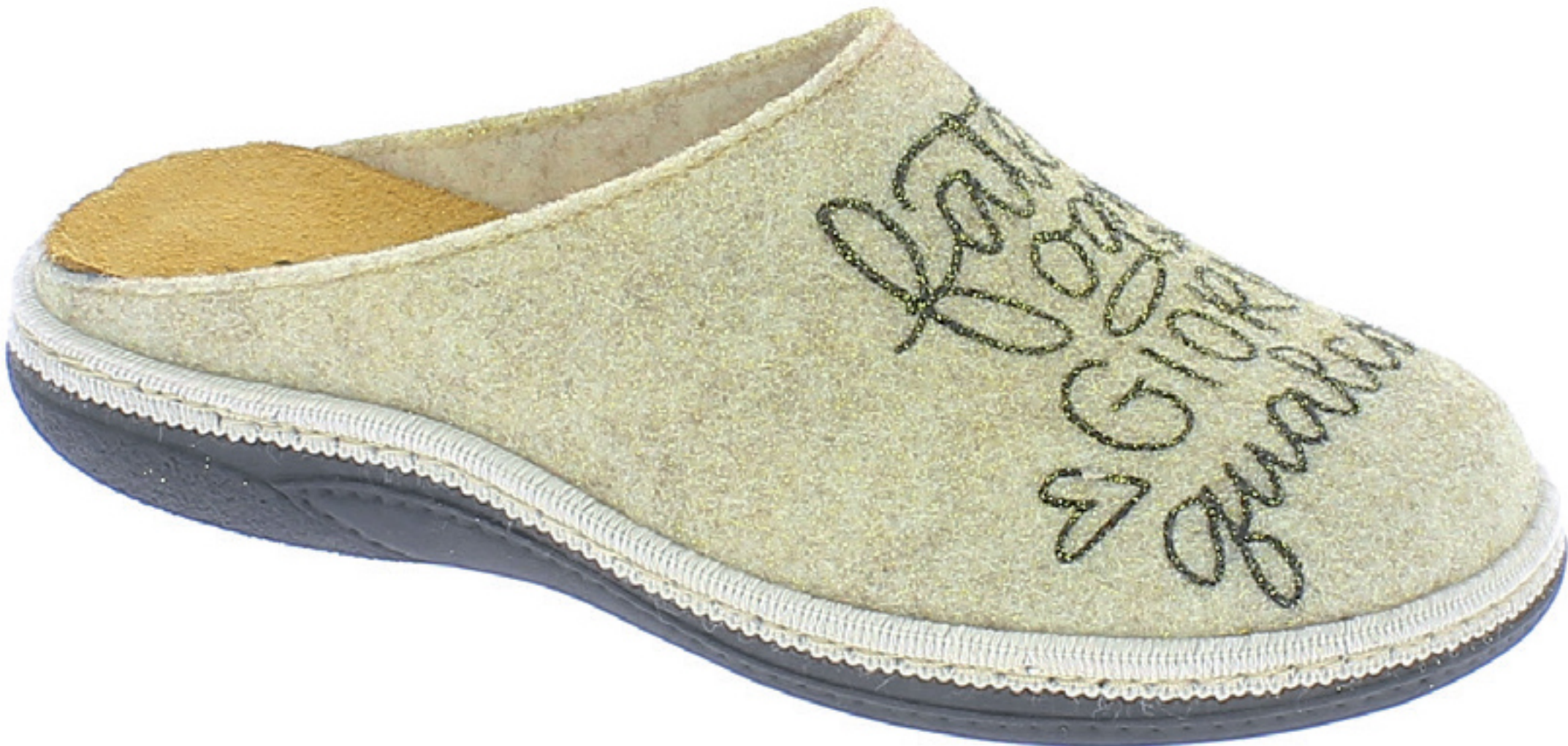
ROSITA COD. 559