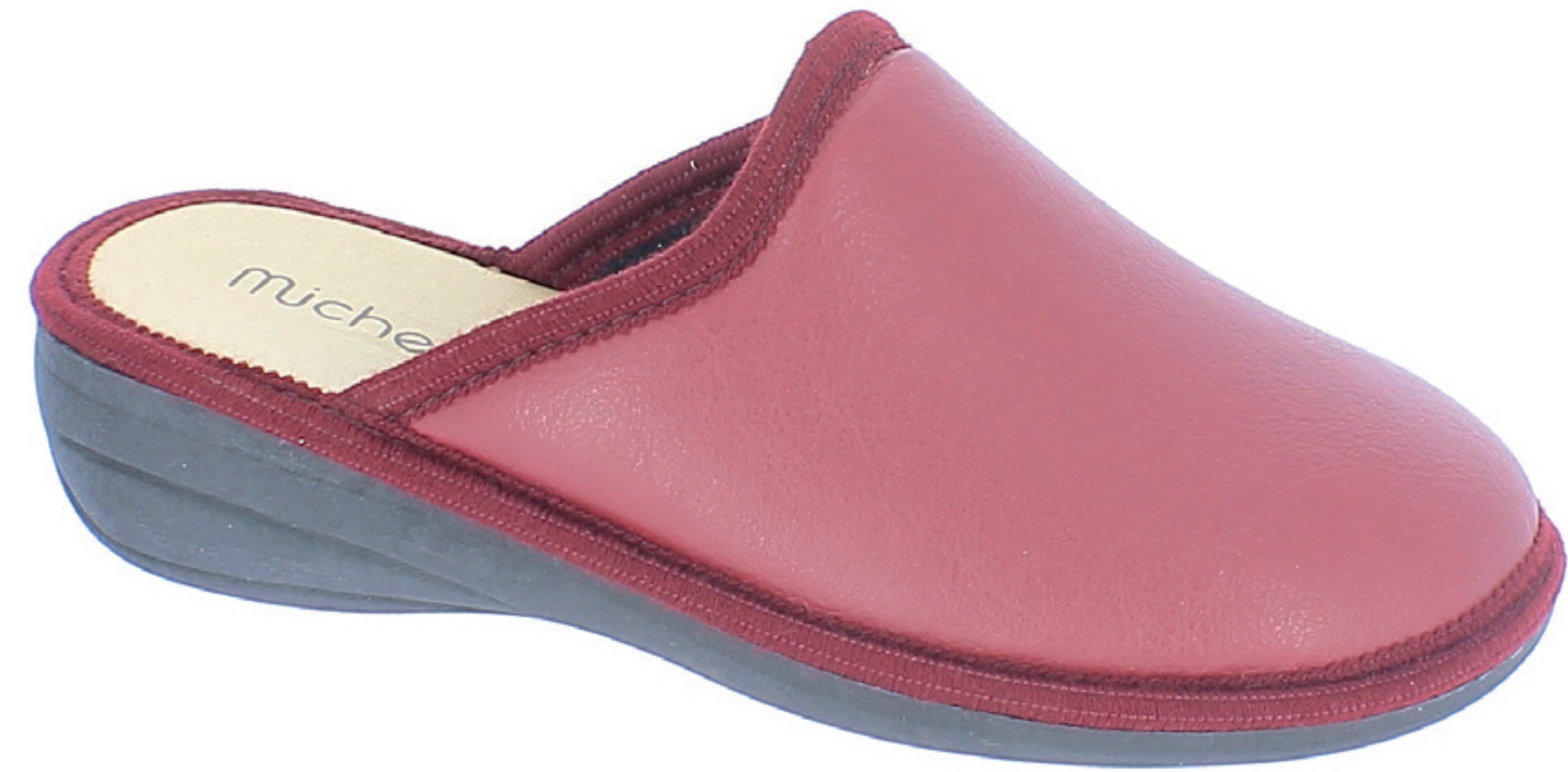
CLARA COD. 551