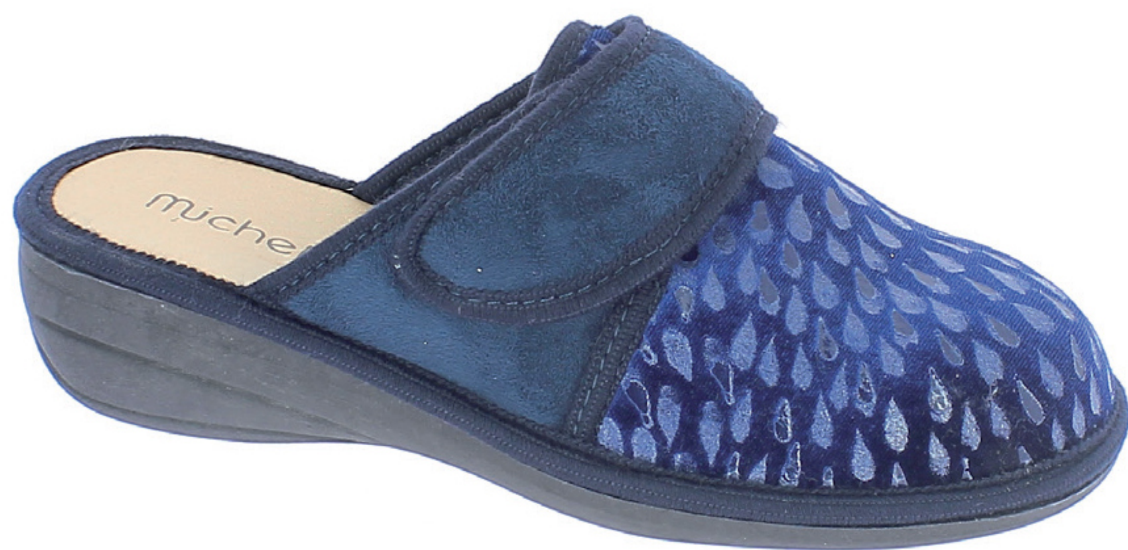
CLARA COD. 560