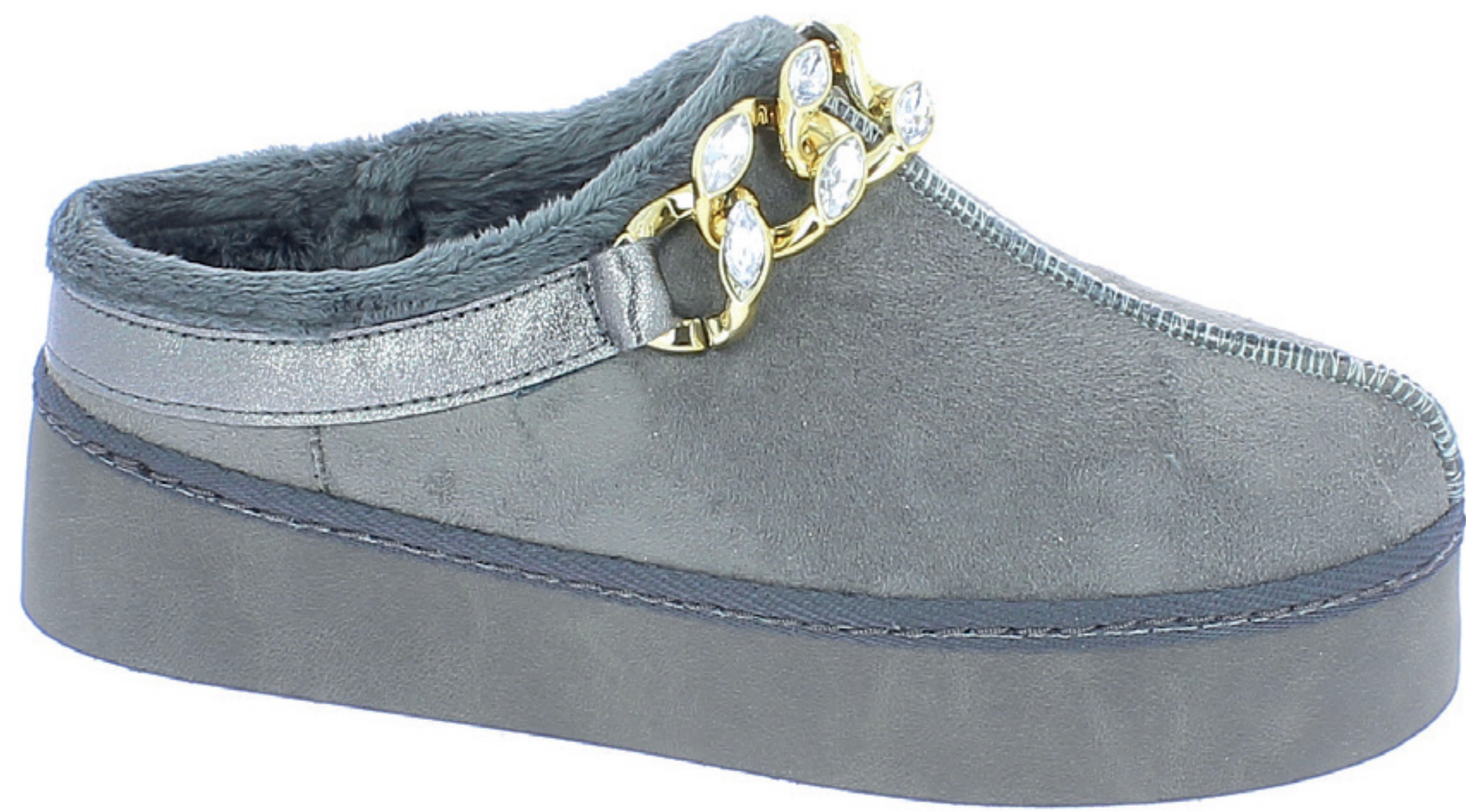
MYA COD. 501