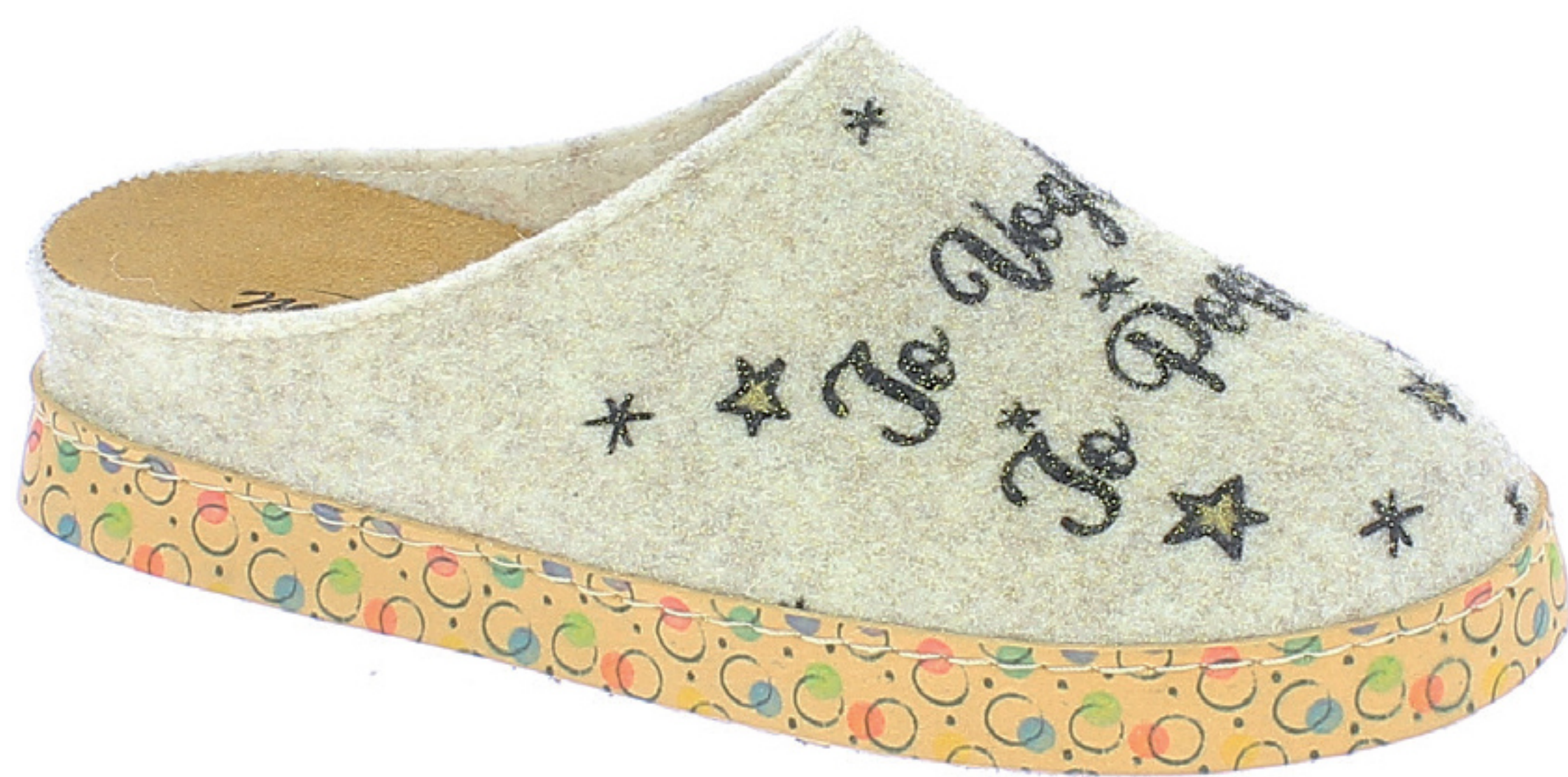
CAMILLA COD. 560