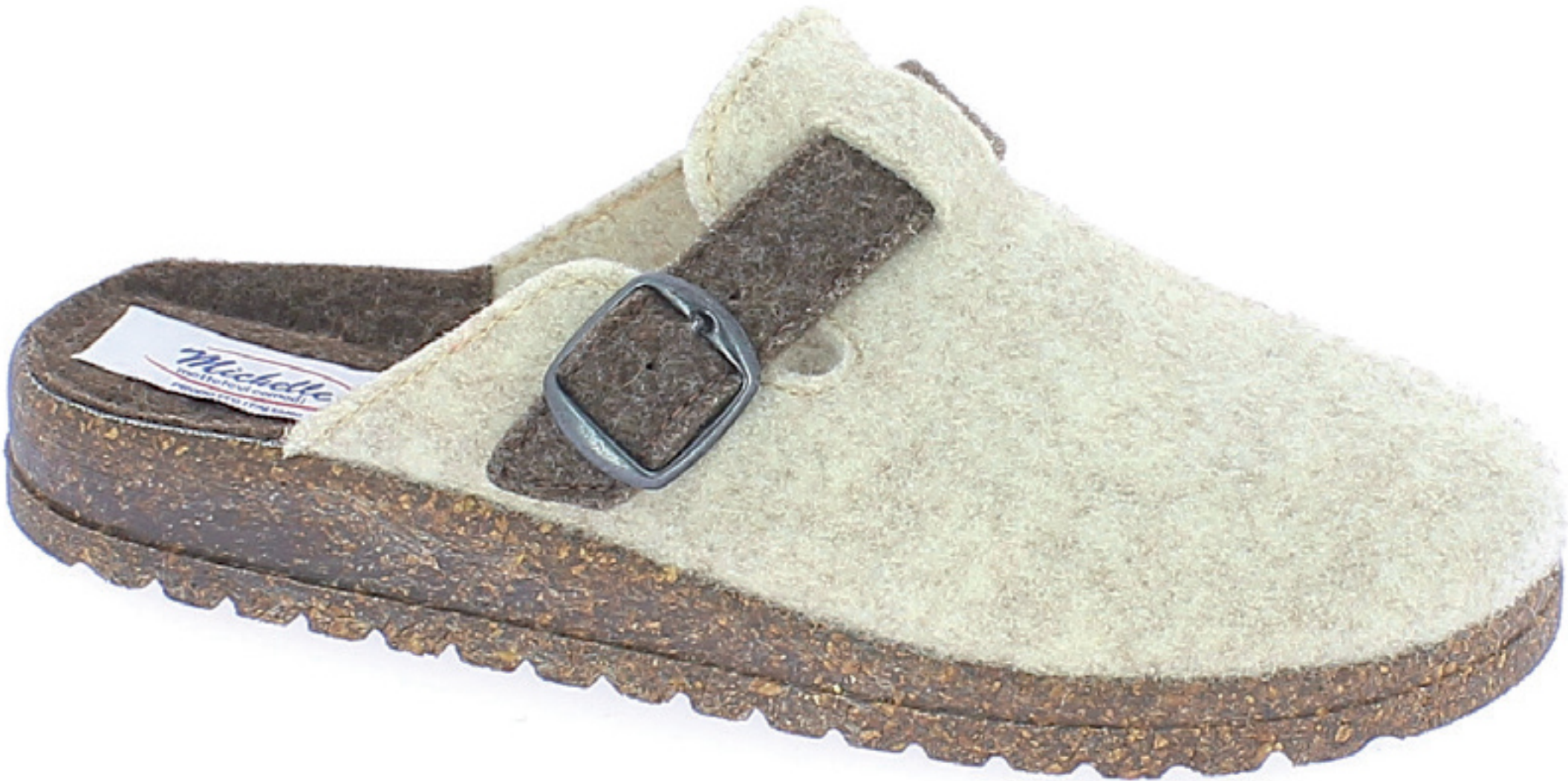
BRASILIA COD. 562