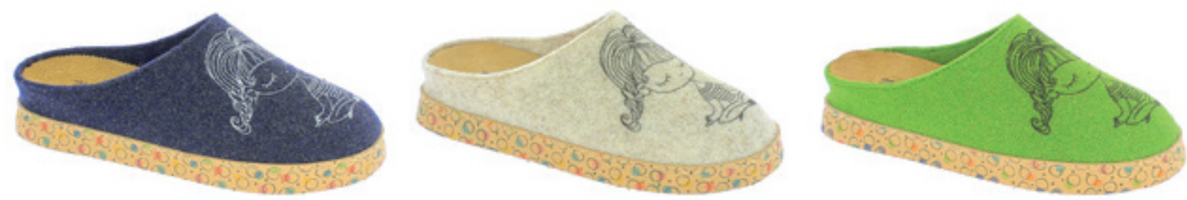
BLU PANNA VERDE