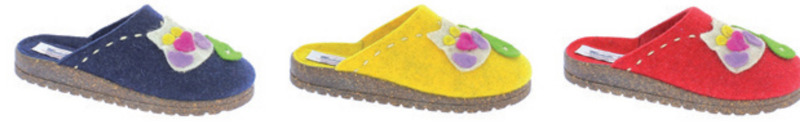
BLU GIALLO RIBES