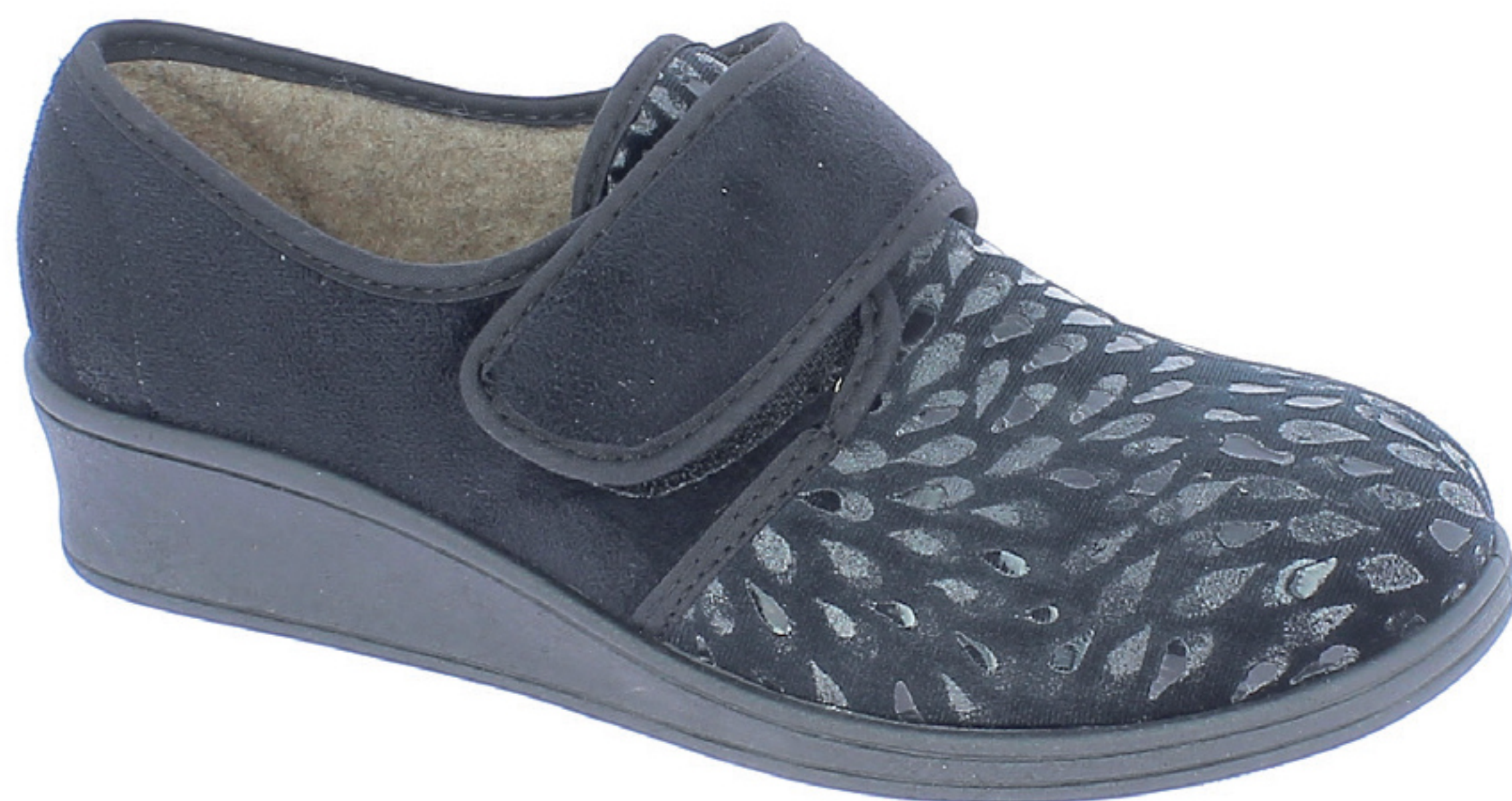
AGNESE COD. 508