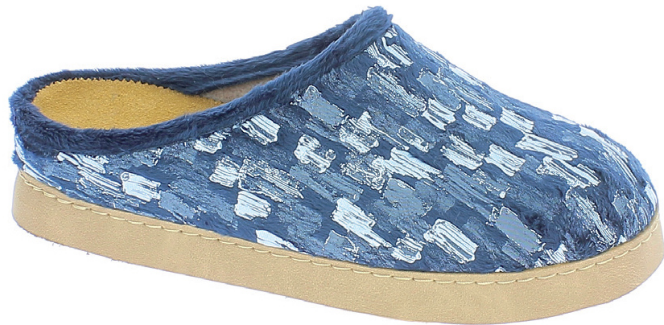
CAMILLA COD. 501