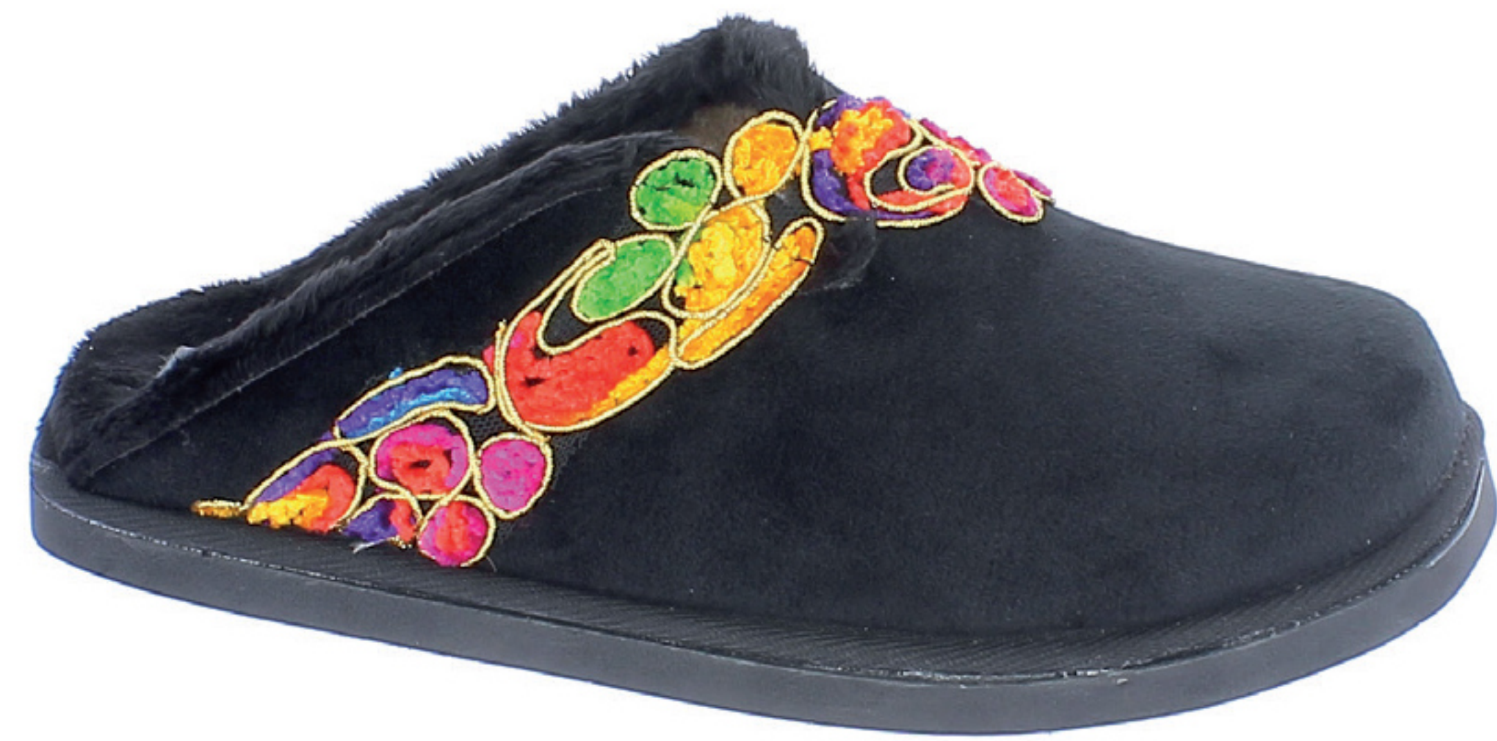
EDDA COD. 505