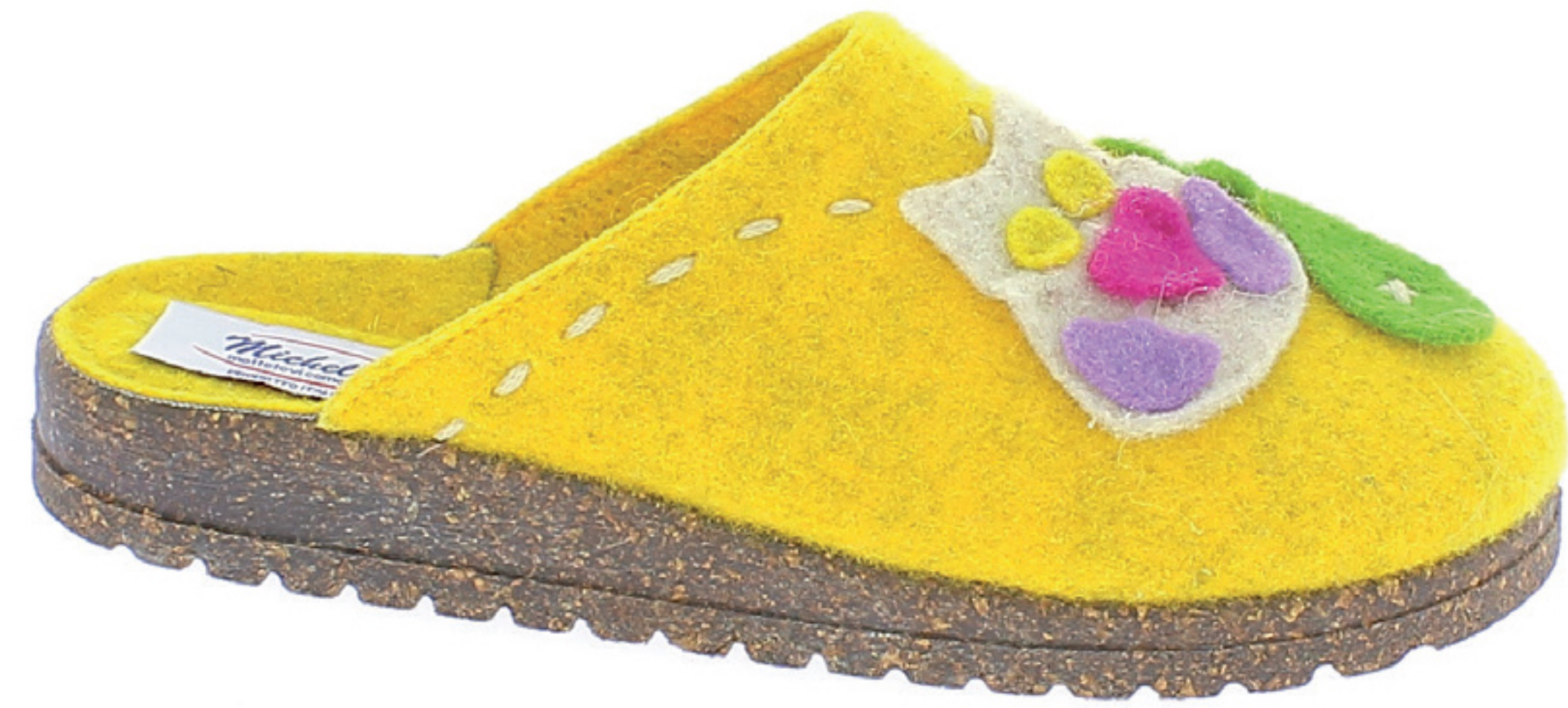
BRASILIA COD. 568