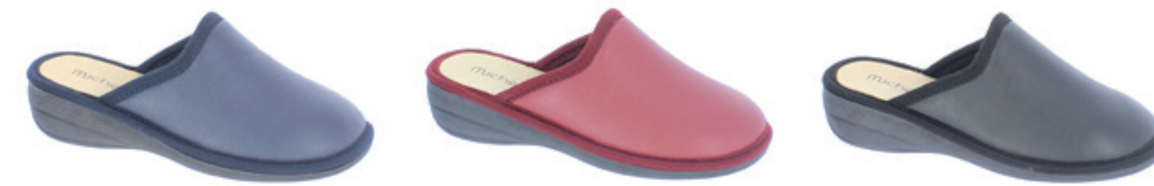
BLU BORDEAUX NERO