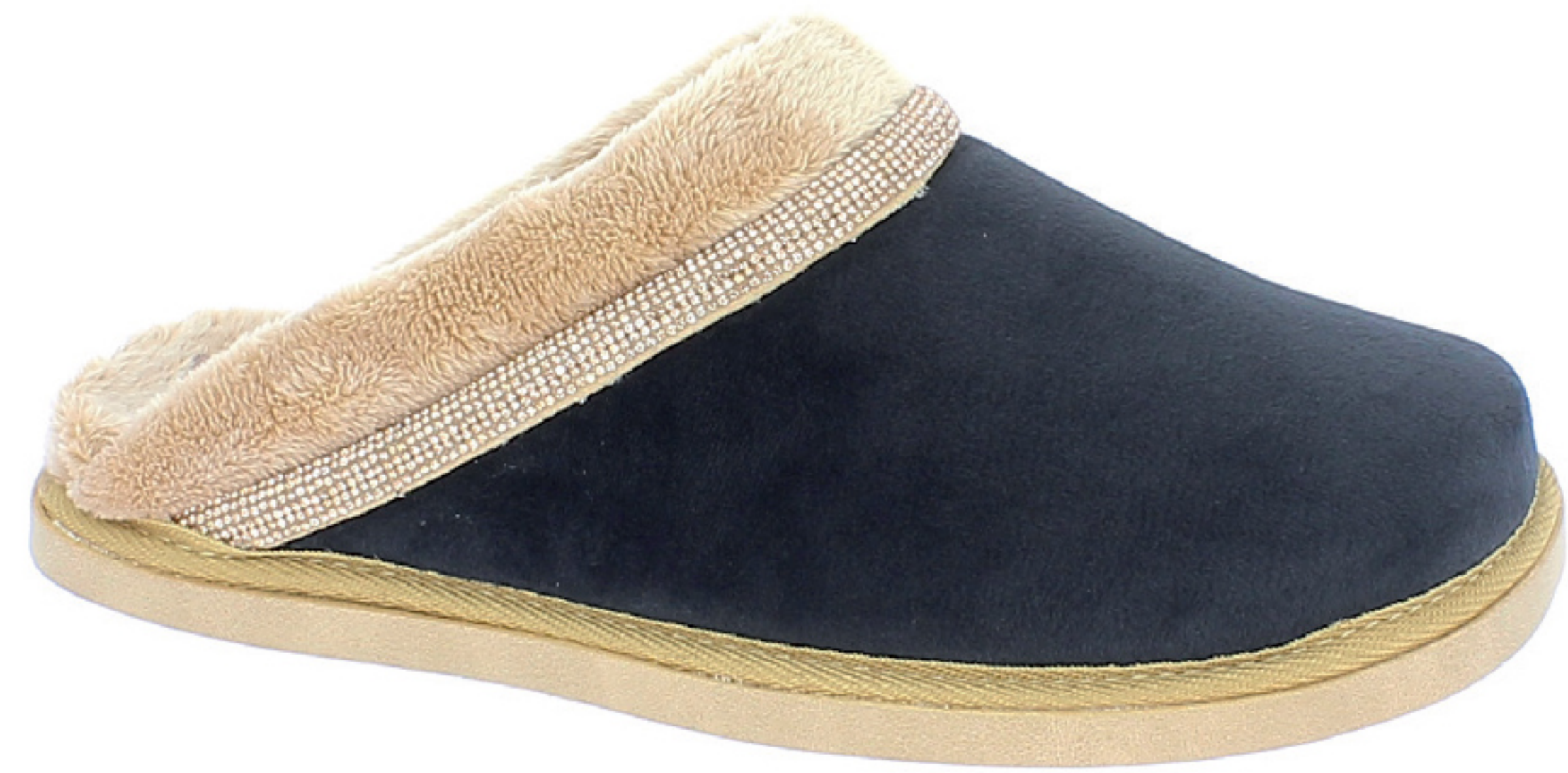
EDDA COD. 501