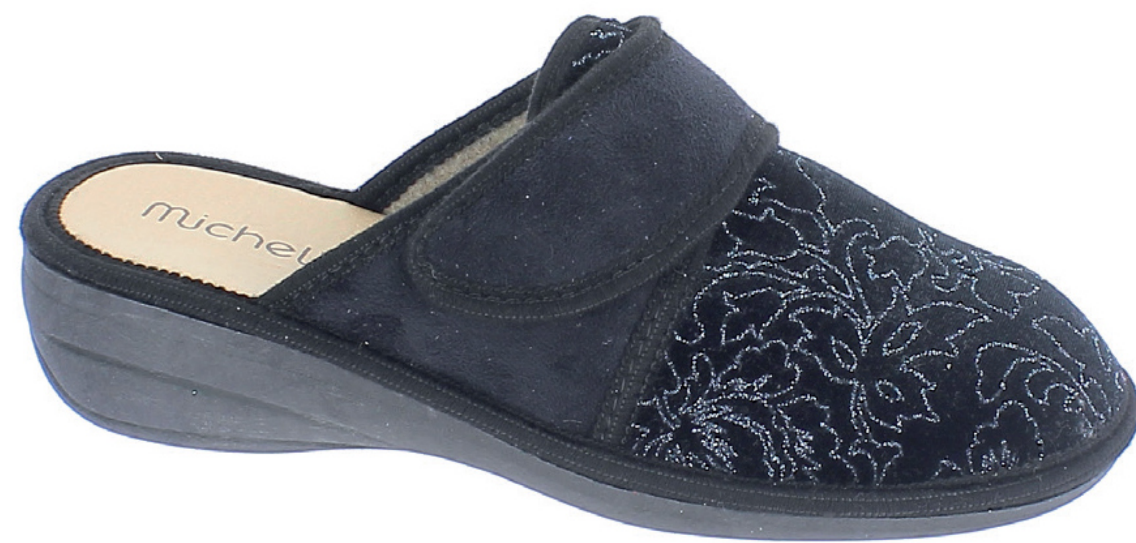
CLARA COD. 561