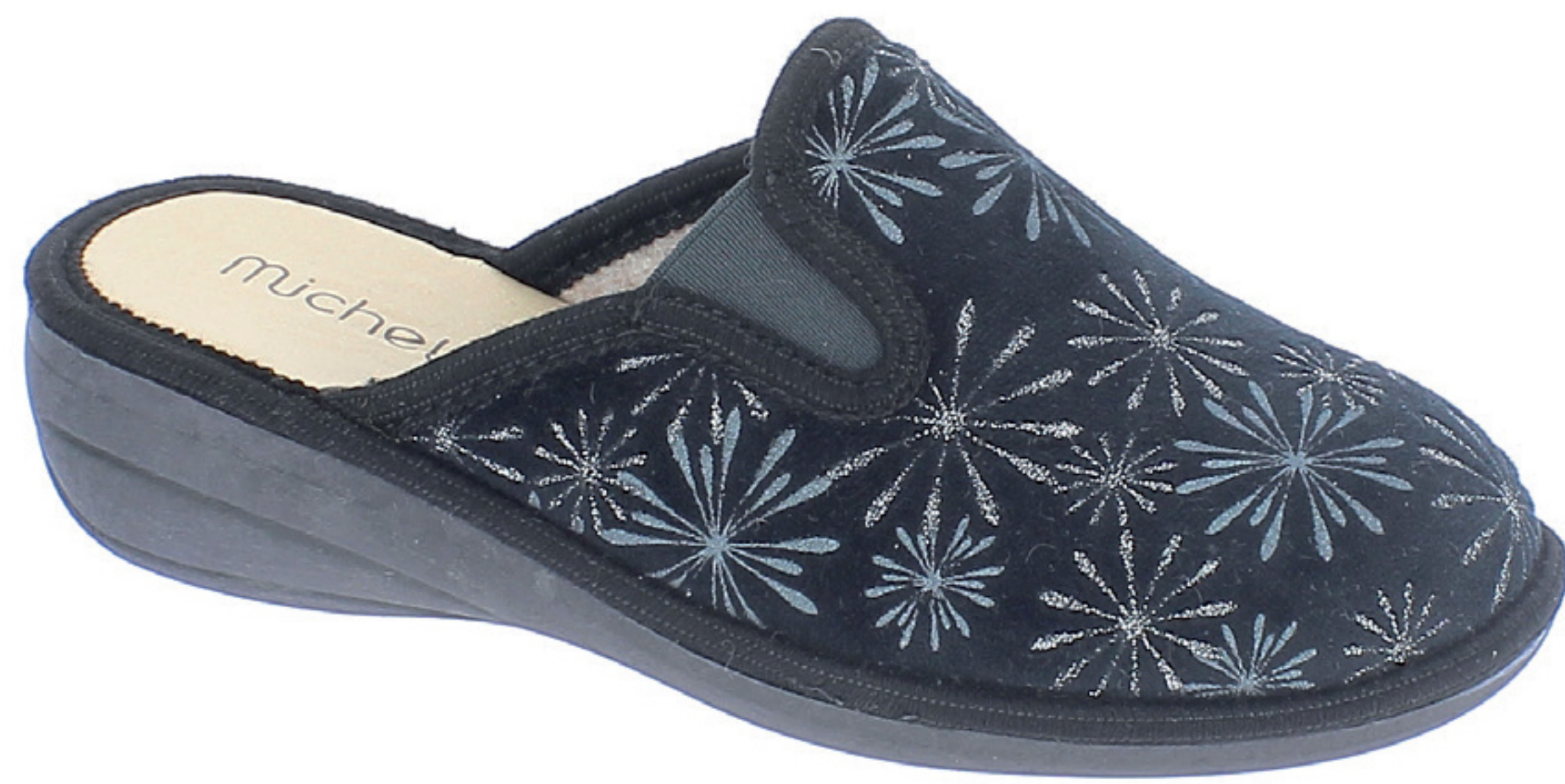
CLARA COD. 570