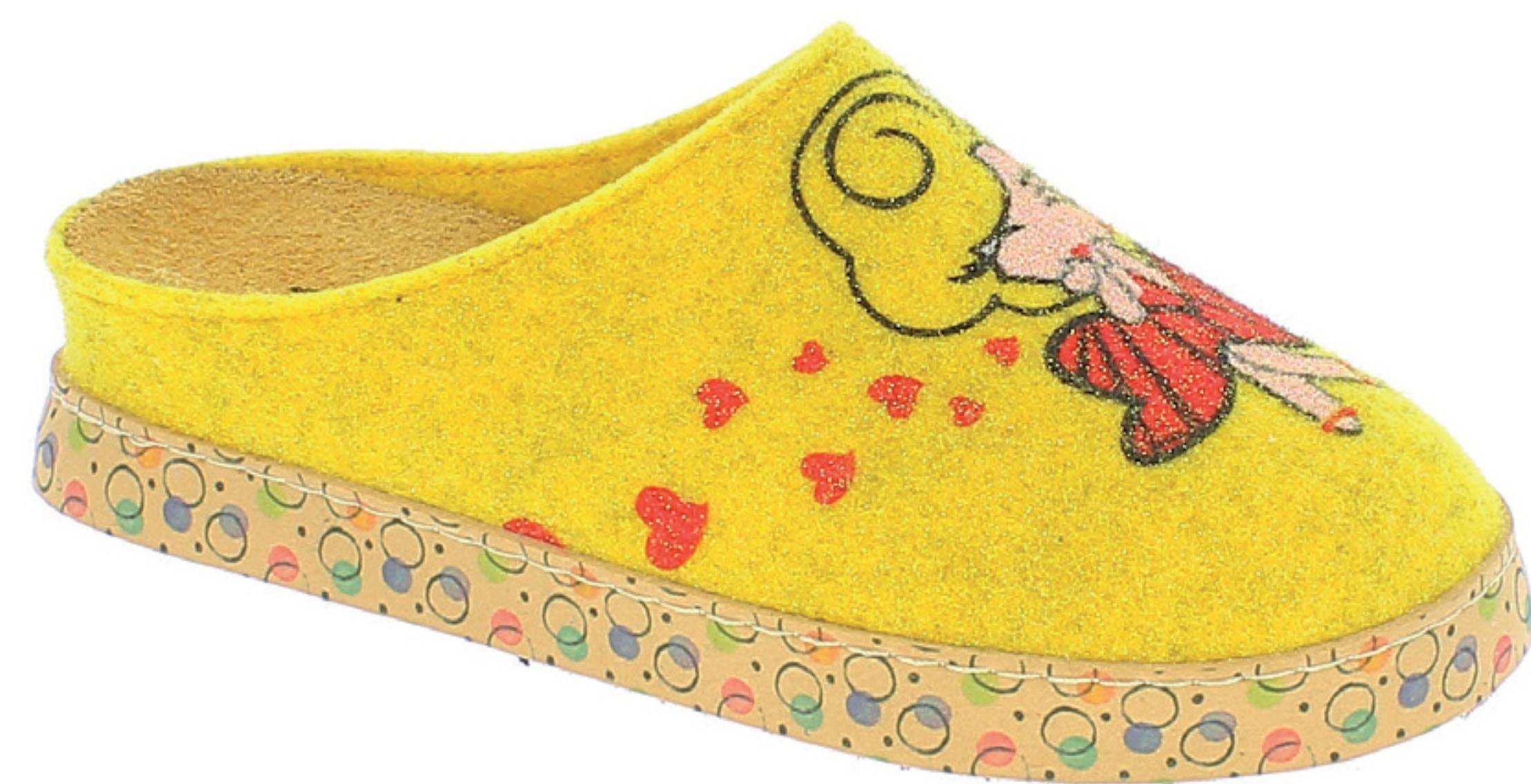
CAMILLA COD. 561