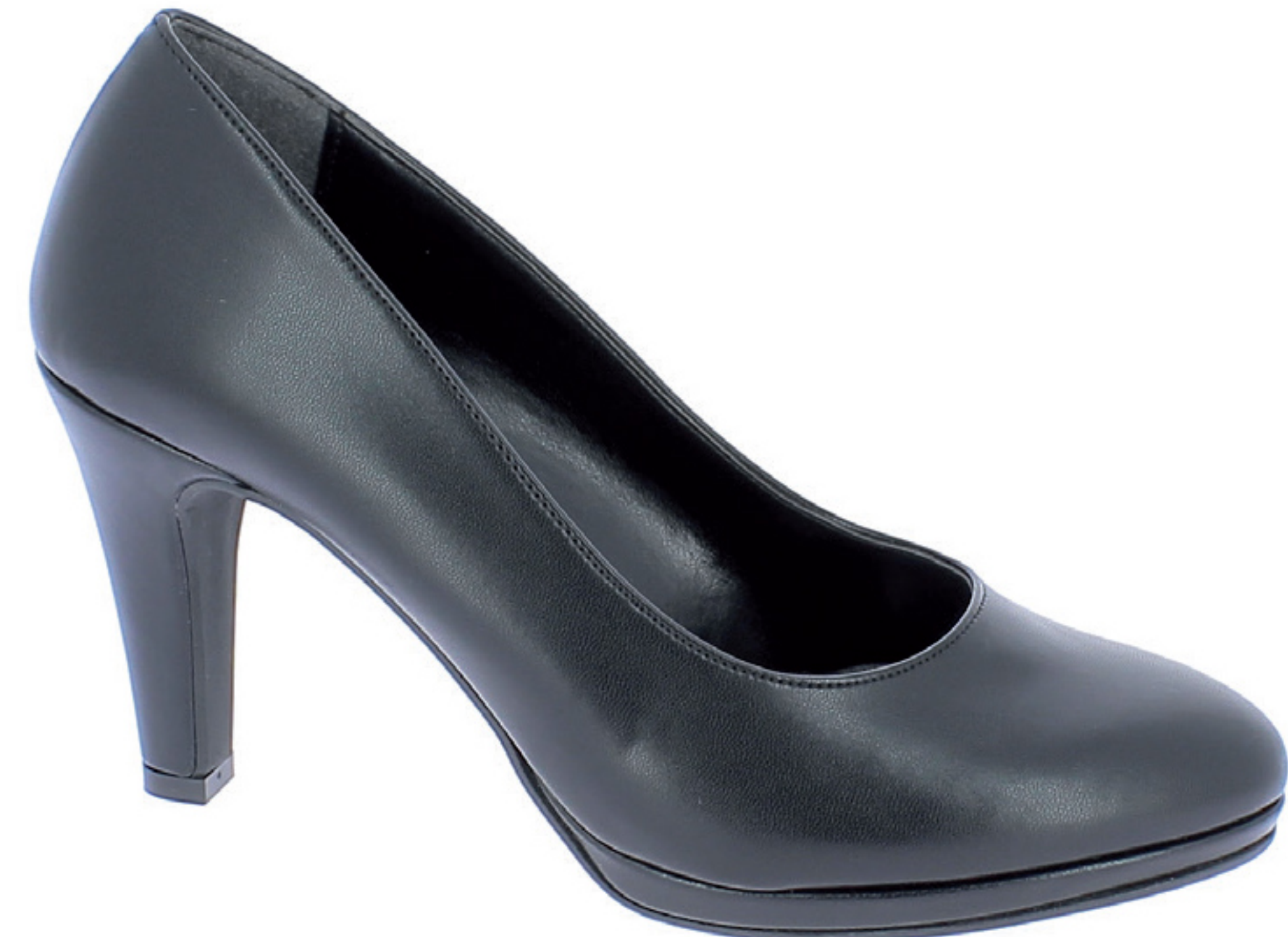
TILDE COD. 501