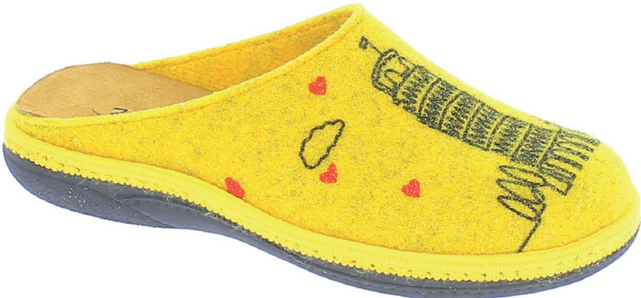
ROSITA COD. 558