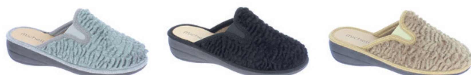
ARGENTO NERO SABBIA