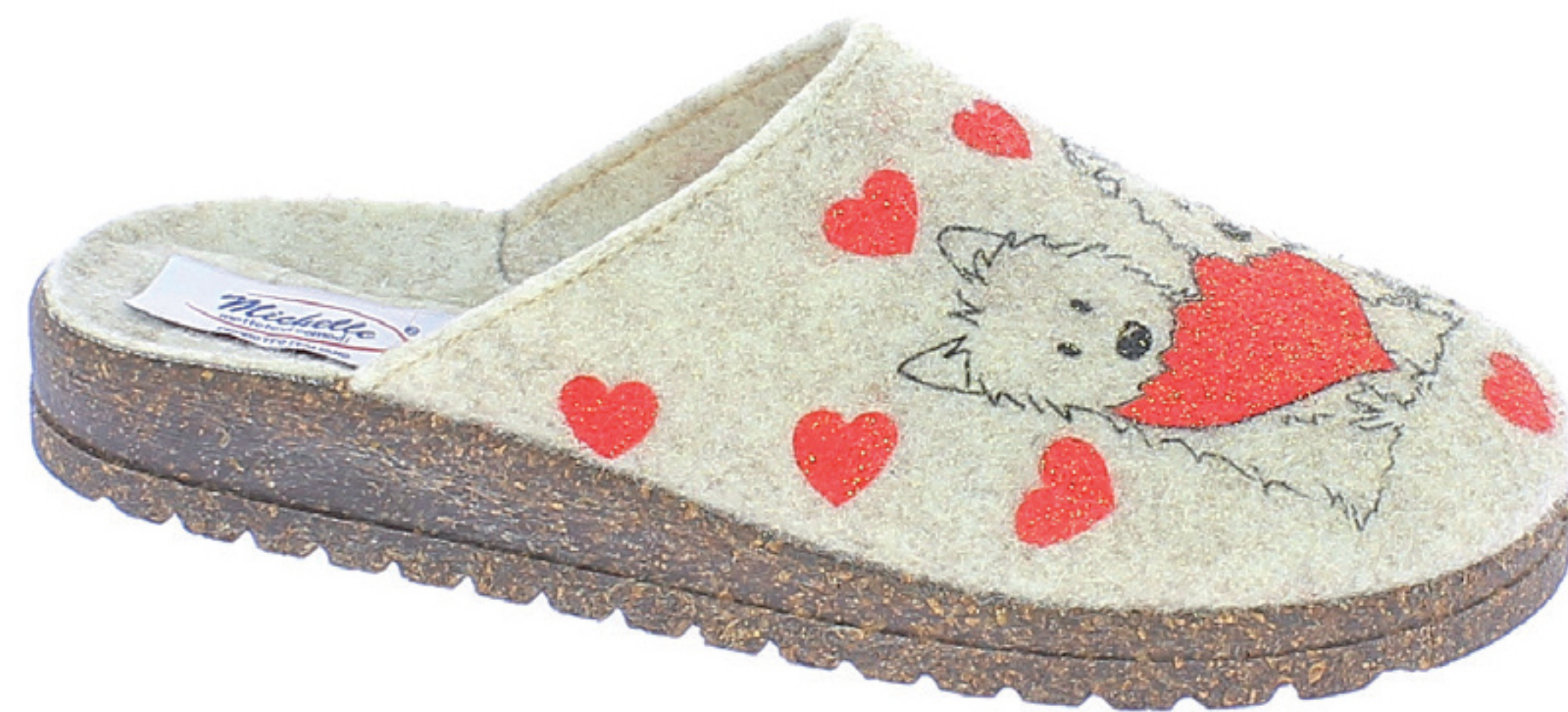
BRASILIA COD. 571