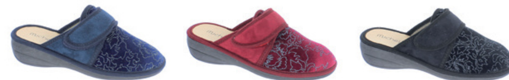
BLU BORDEAUX NERO