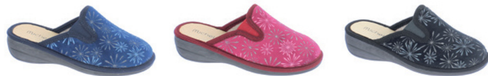
BLU BORDEAUX NERO