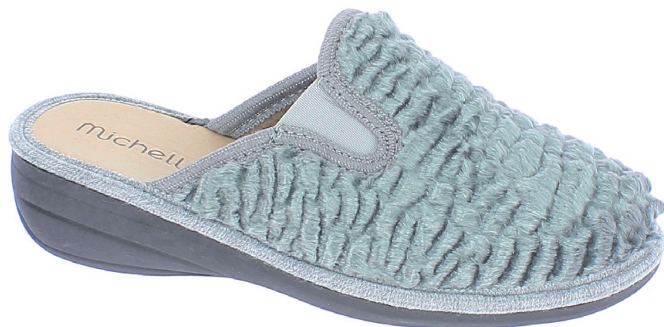
CLARA COD. 571