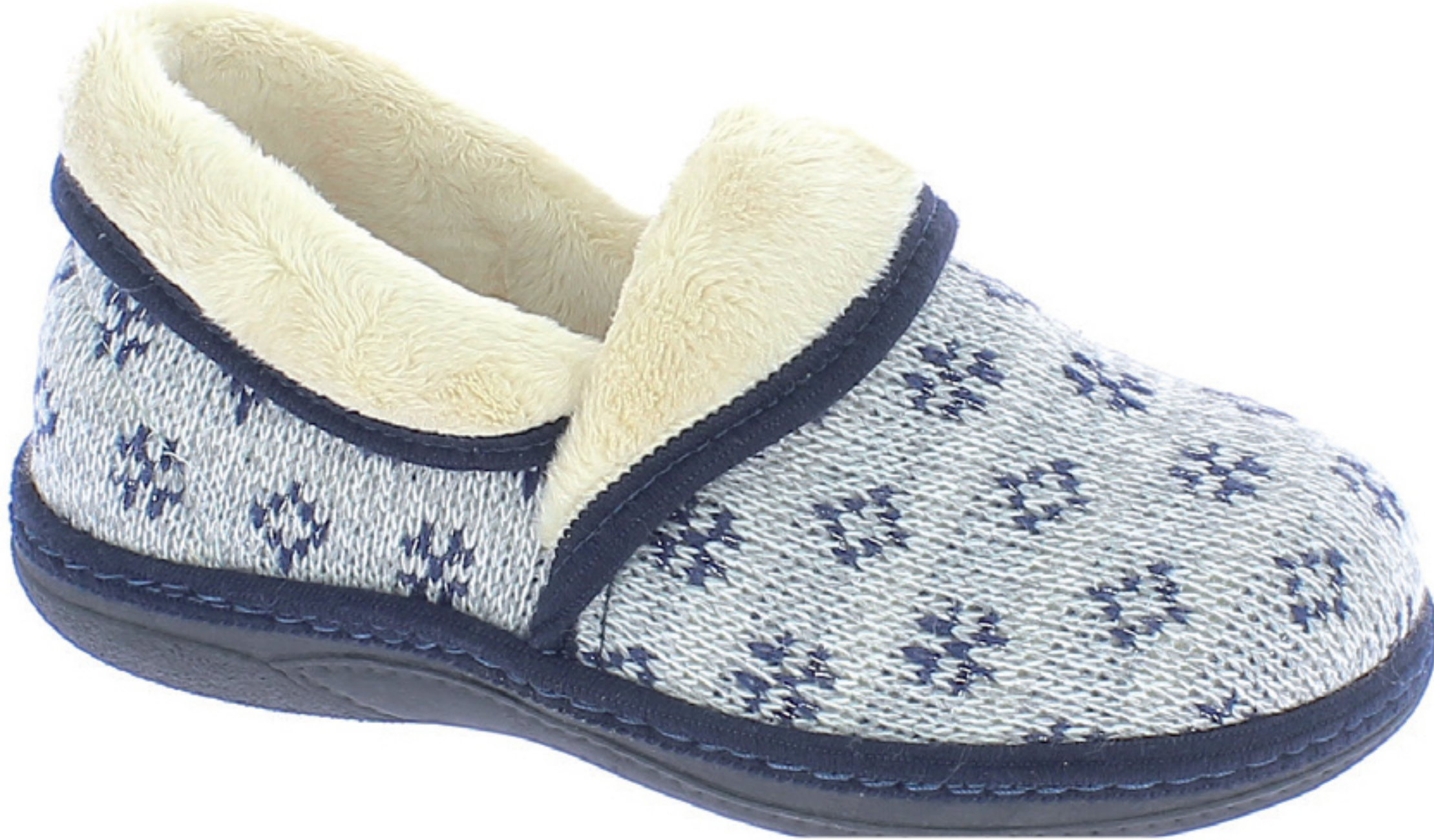
ROSITA COD. 580