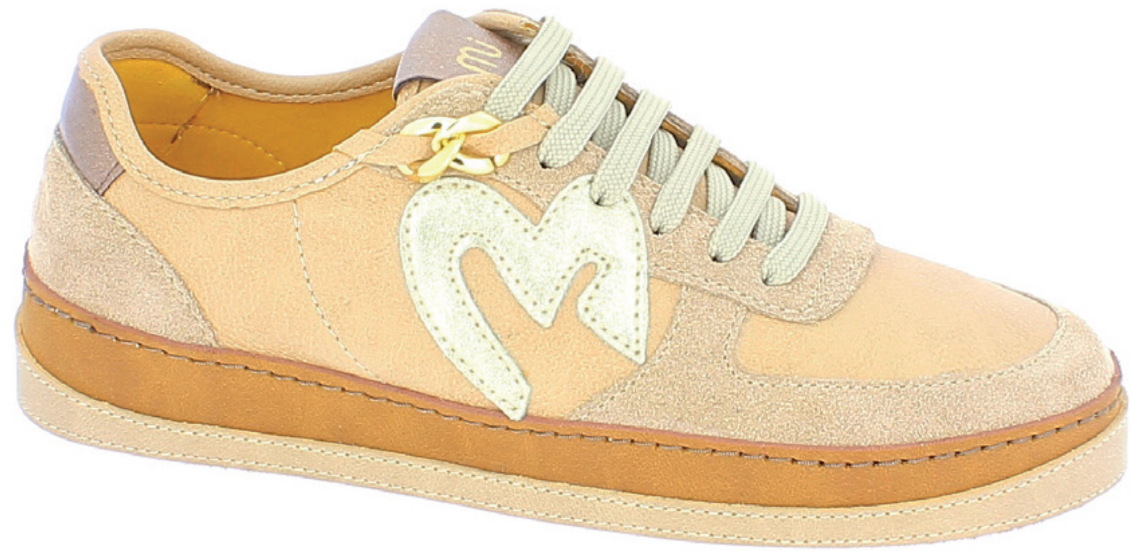
GILDA COD. 501