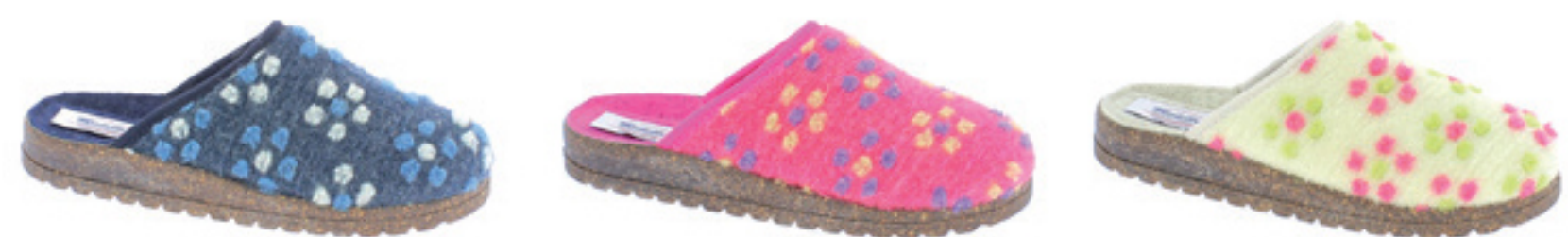
BLU PANNA PANNA