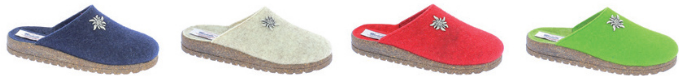
BLU PANNA RIBES VERDE