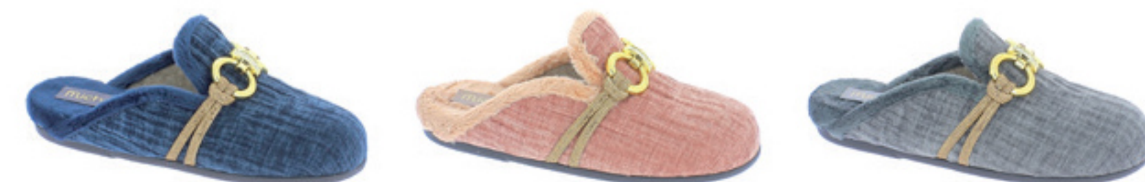
BLU CIPRIA GRIGIO