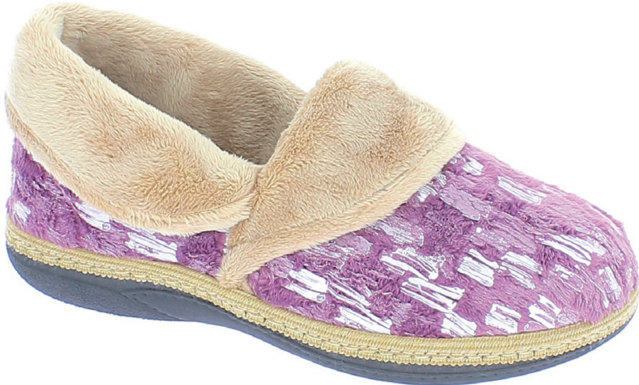
ROSITA COD. 581