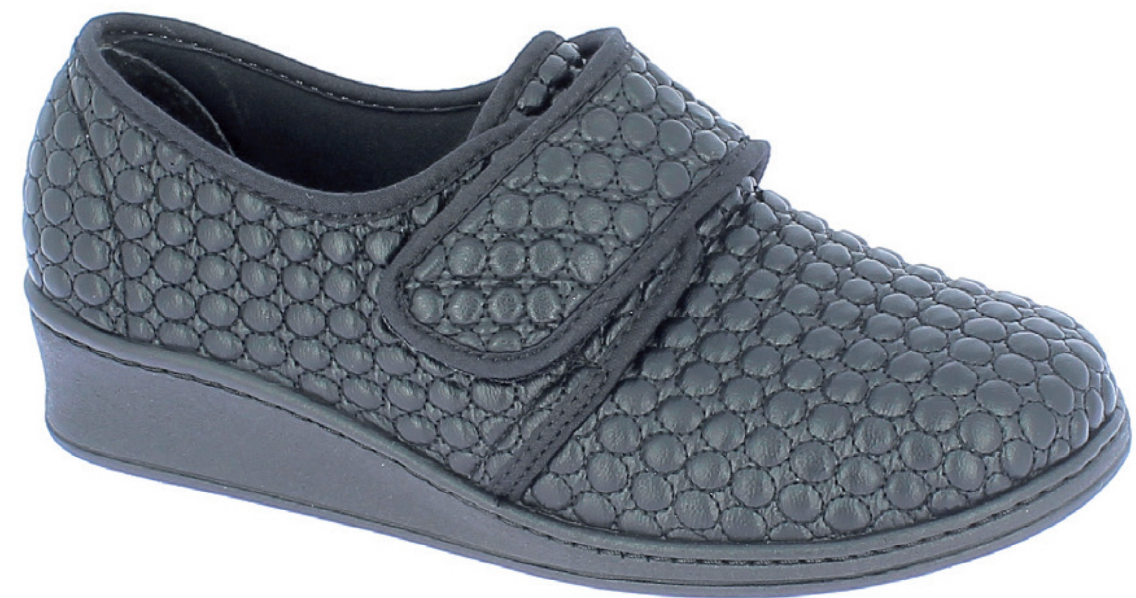
AGNESE COD. 501