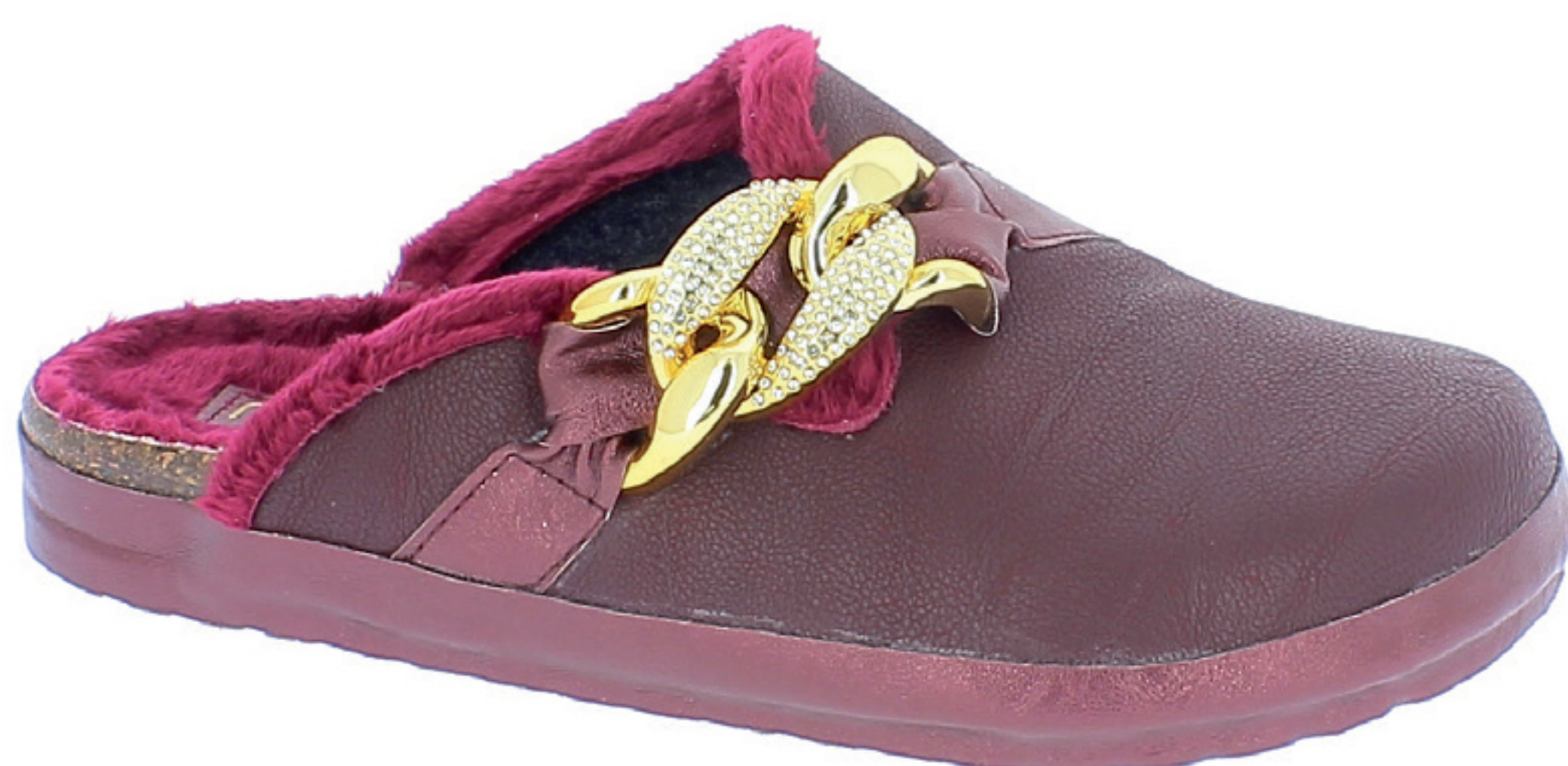
TERESA COD. 502