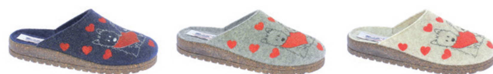
BLU GRIGIO PANNA