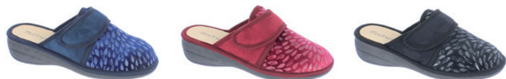
BLU BORDEAUX NERO