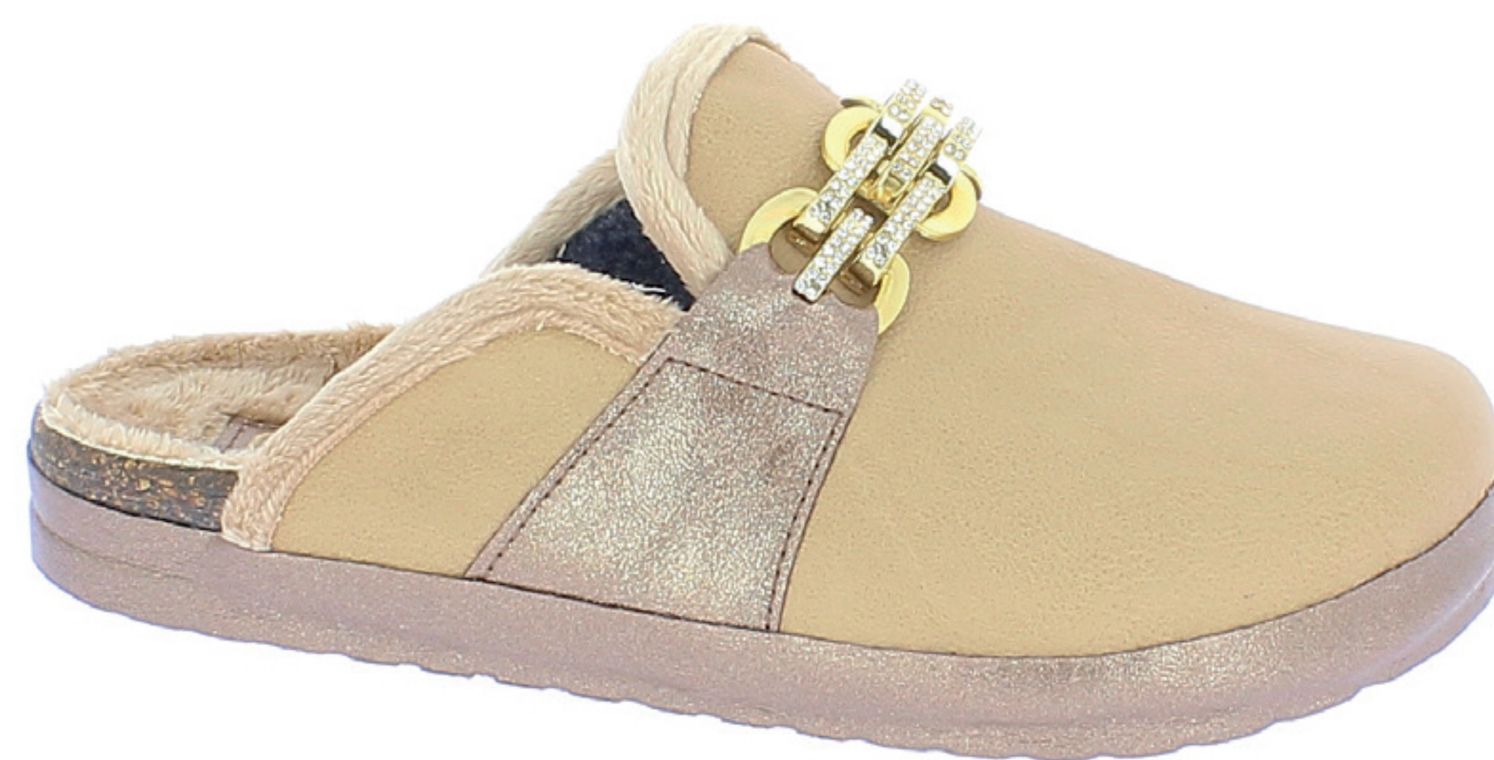
TERESA COD. 503