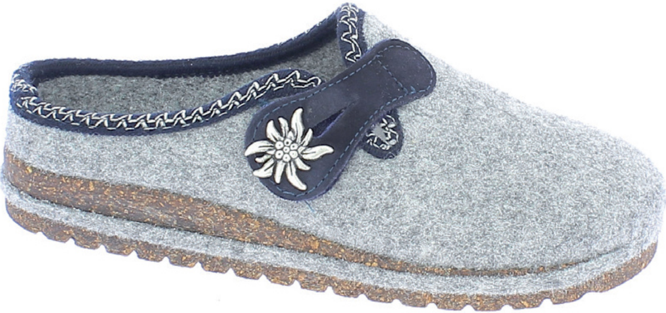
BRASILIA COD. 550