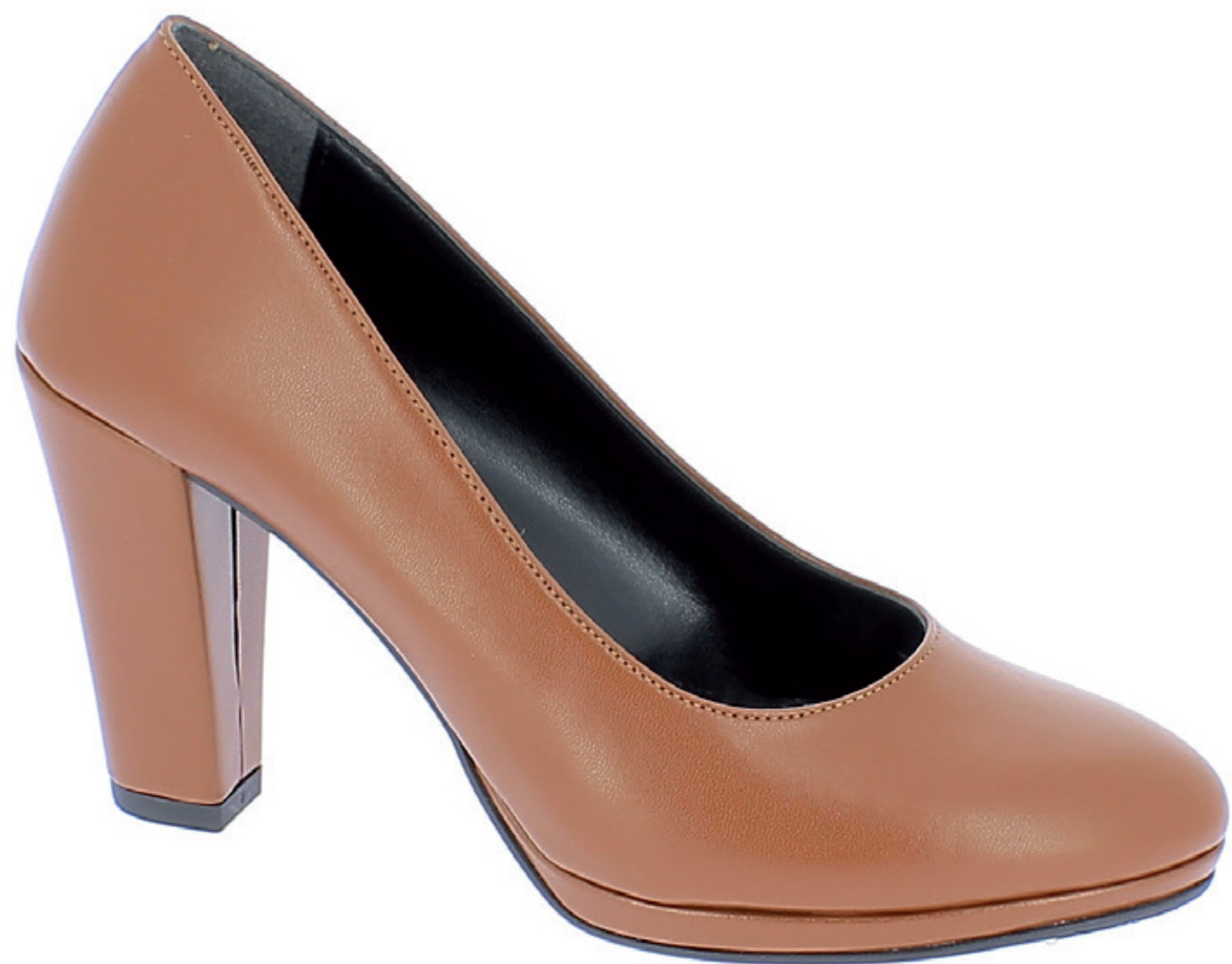
TALIA COD. 501