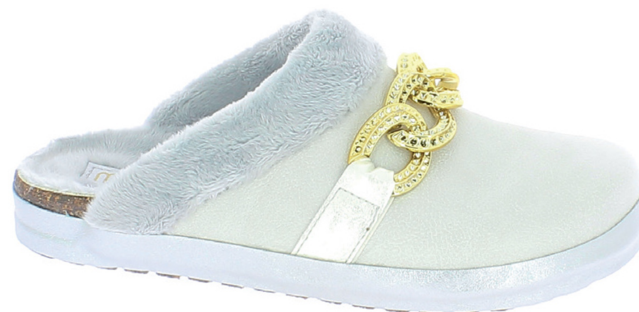
TERESA COD. 504