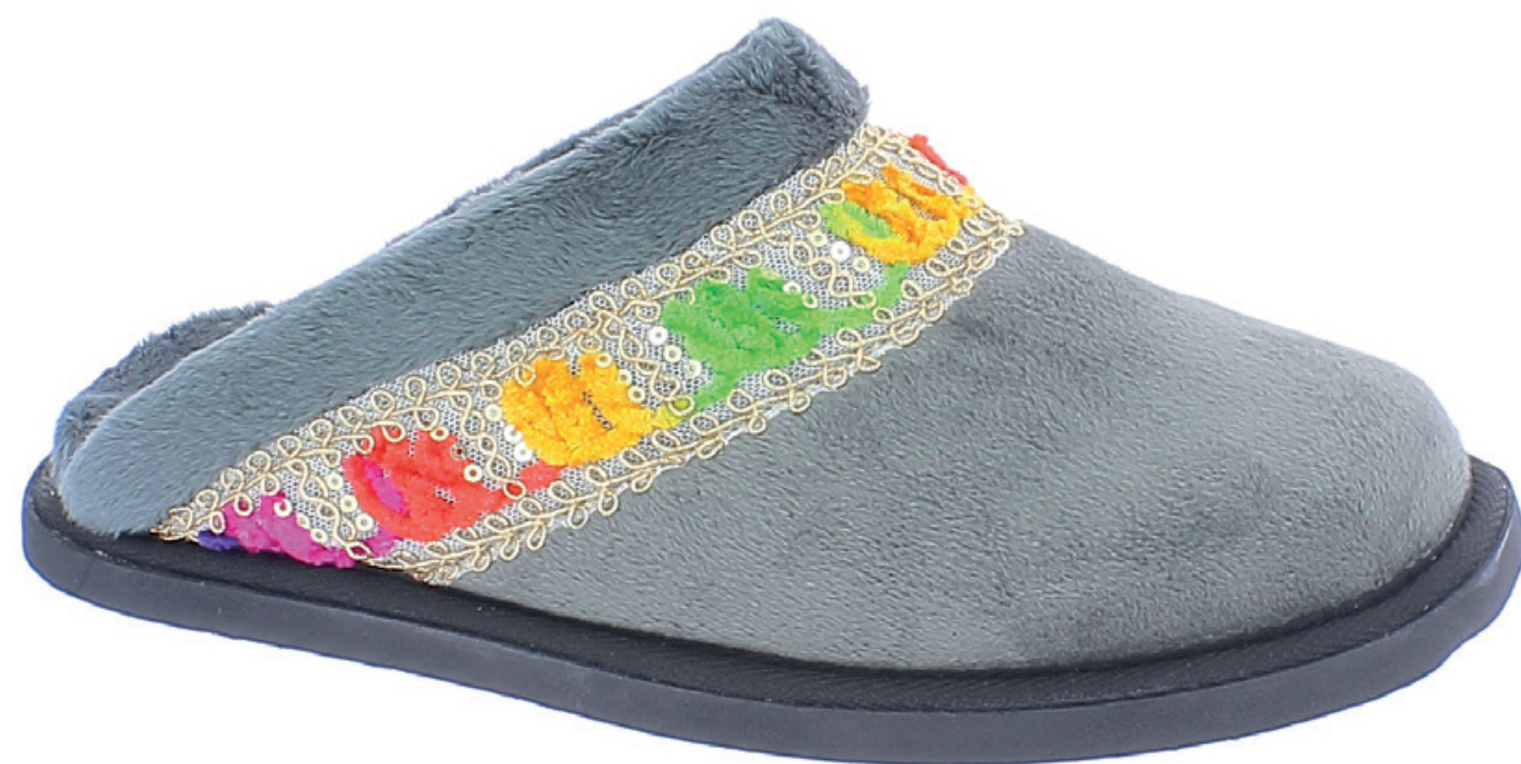
EDDA COD. 504