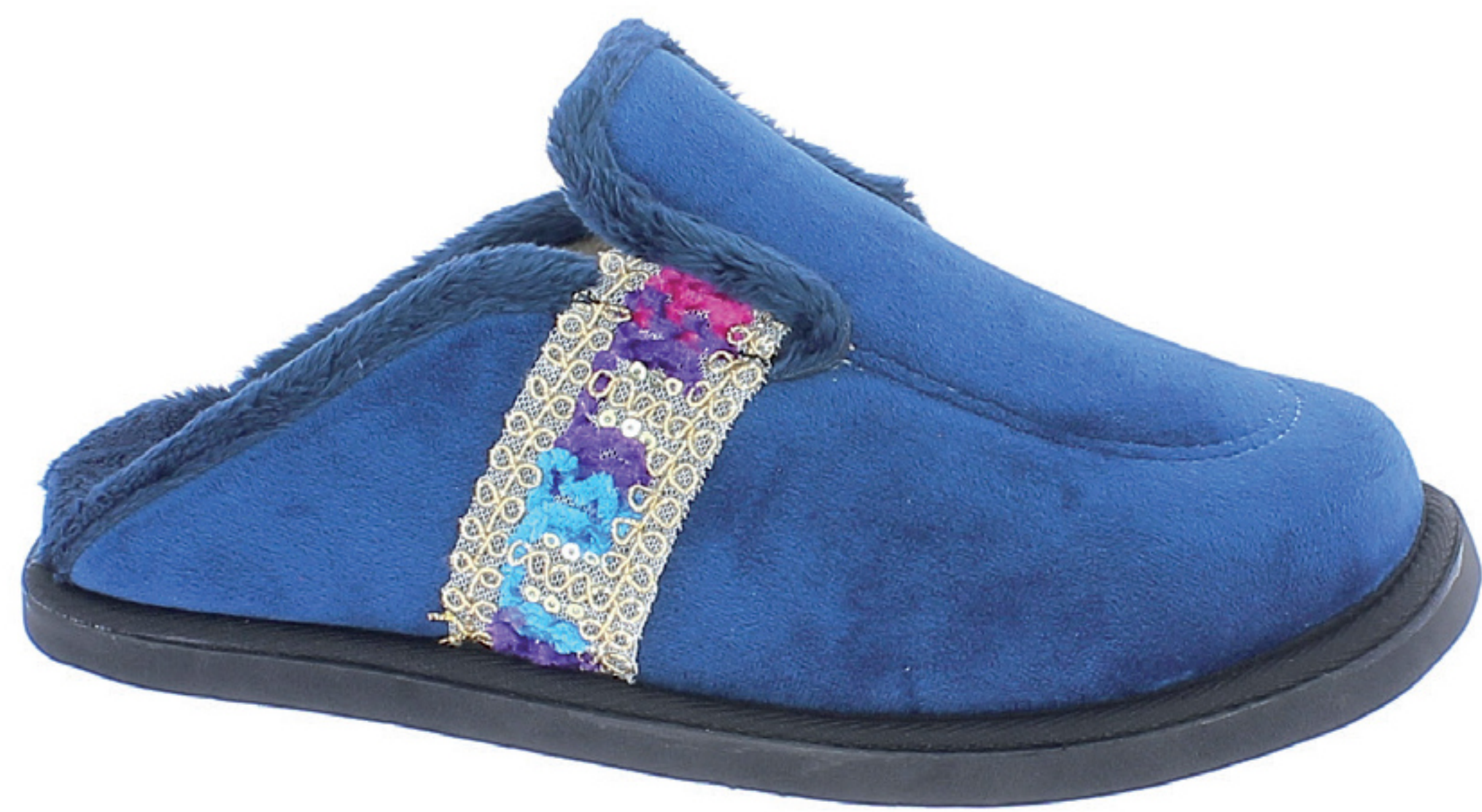
EDDA COD. 506