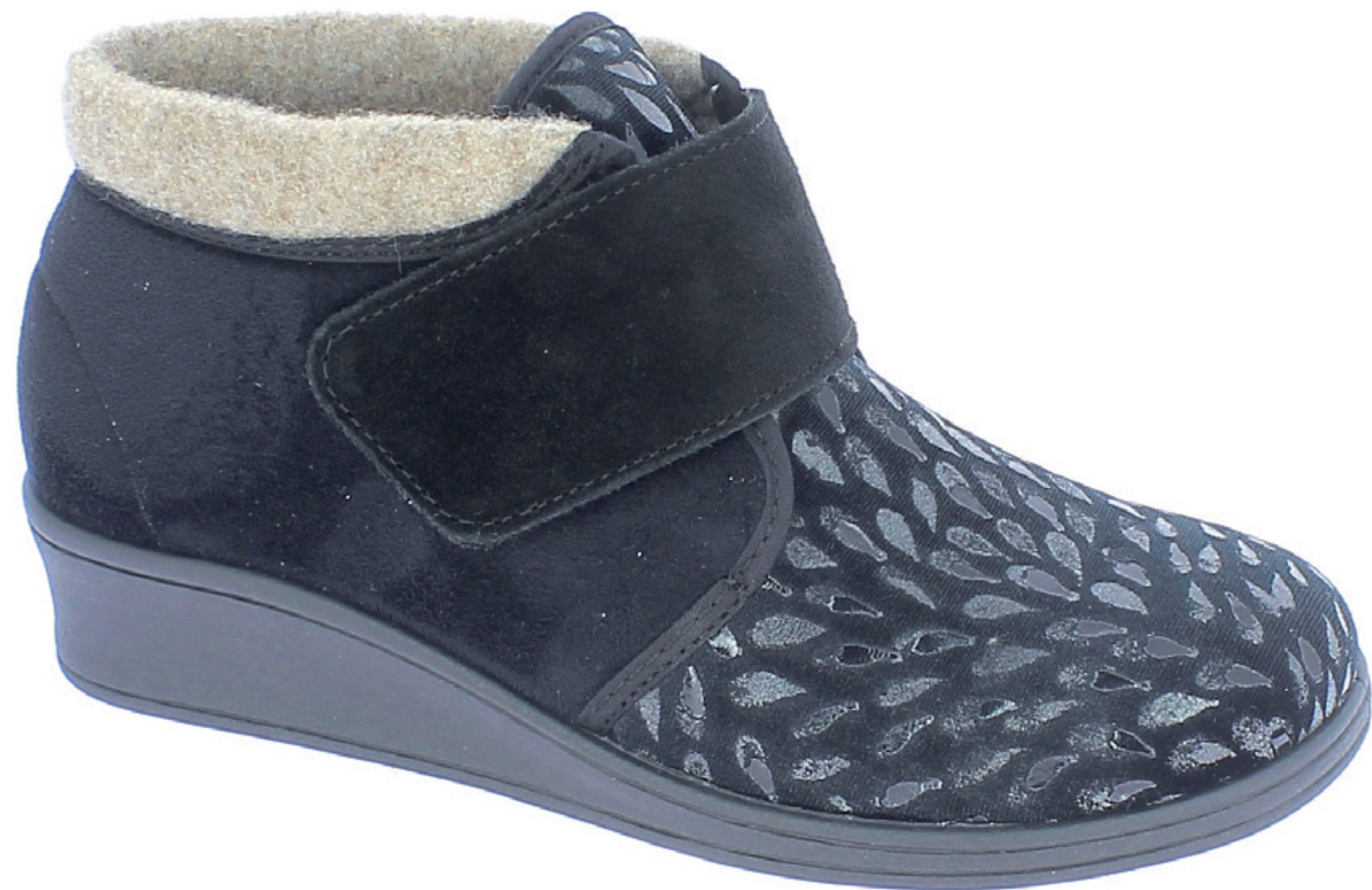
AGNESE COD. 580