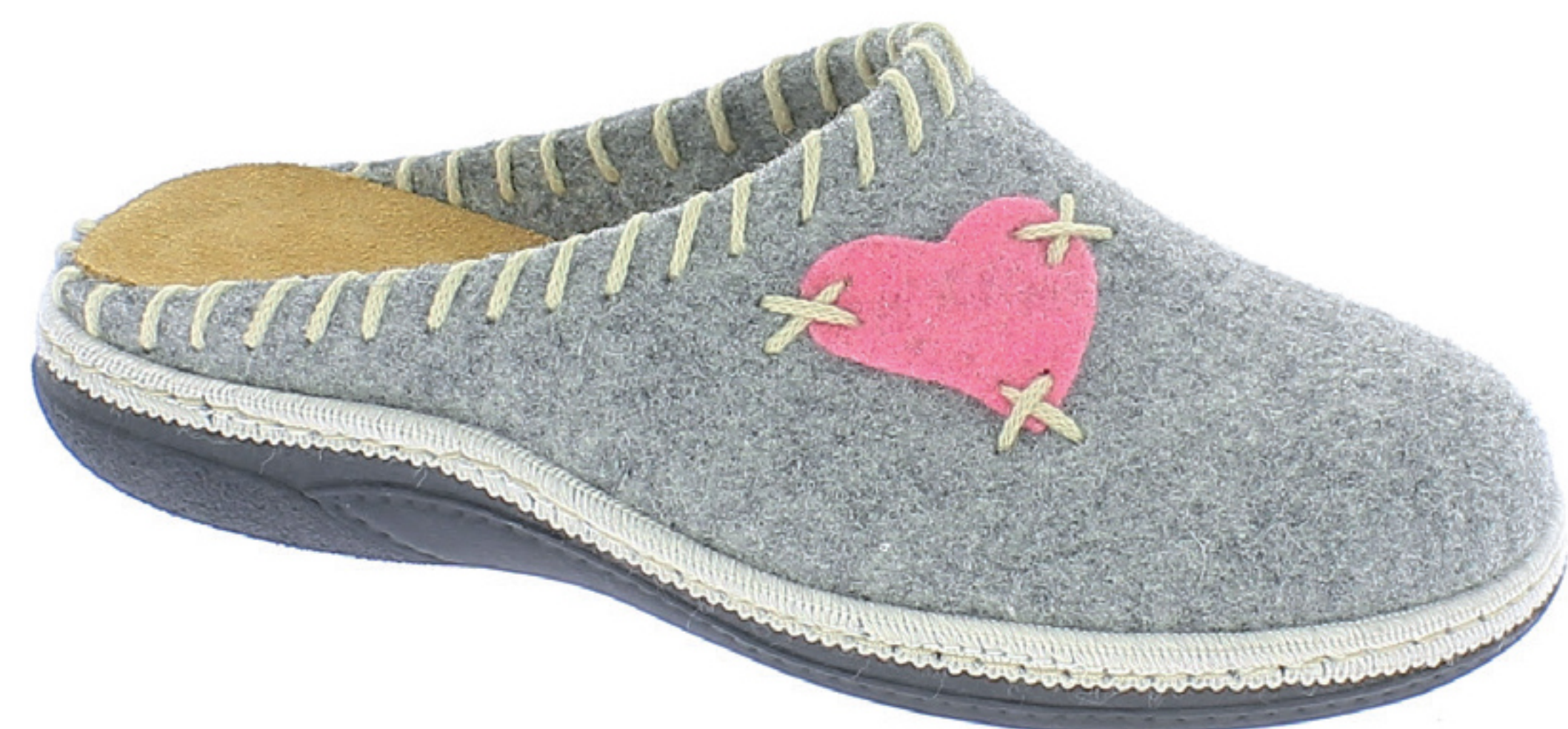
ROSITA COD. 556 GRIGIO