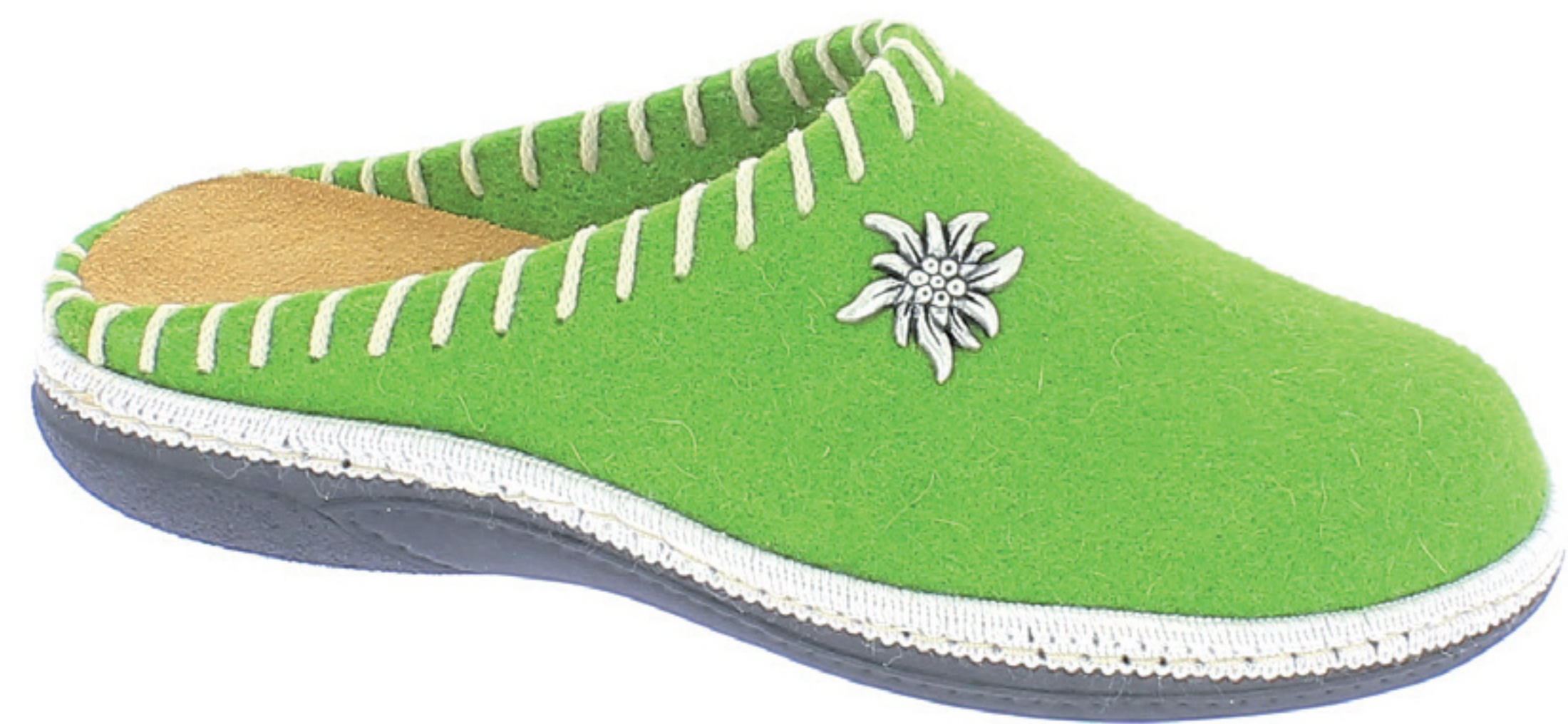
ROSITA COD. 555 VERDE