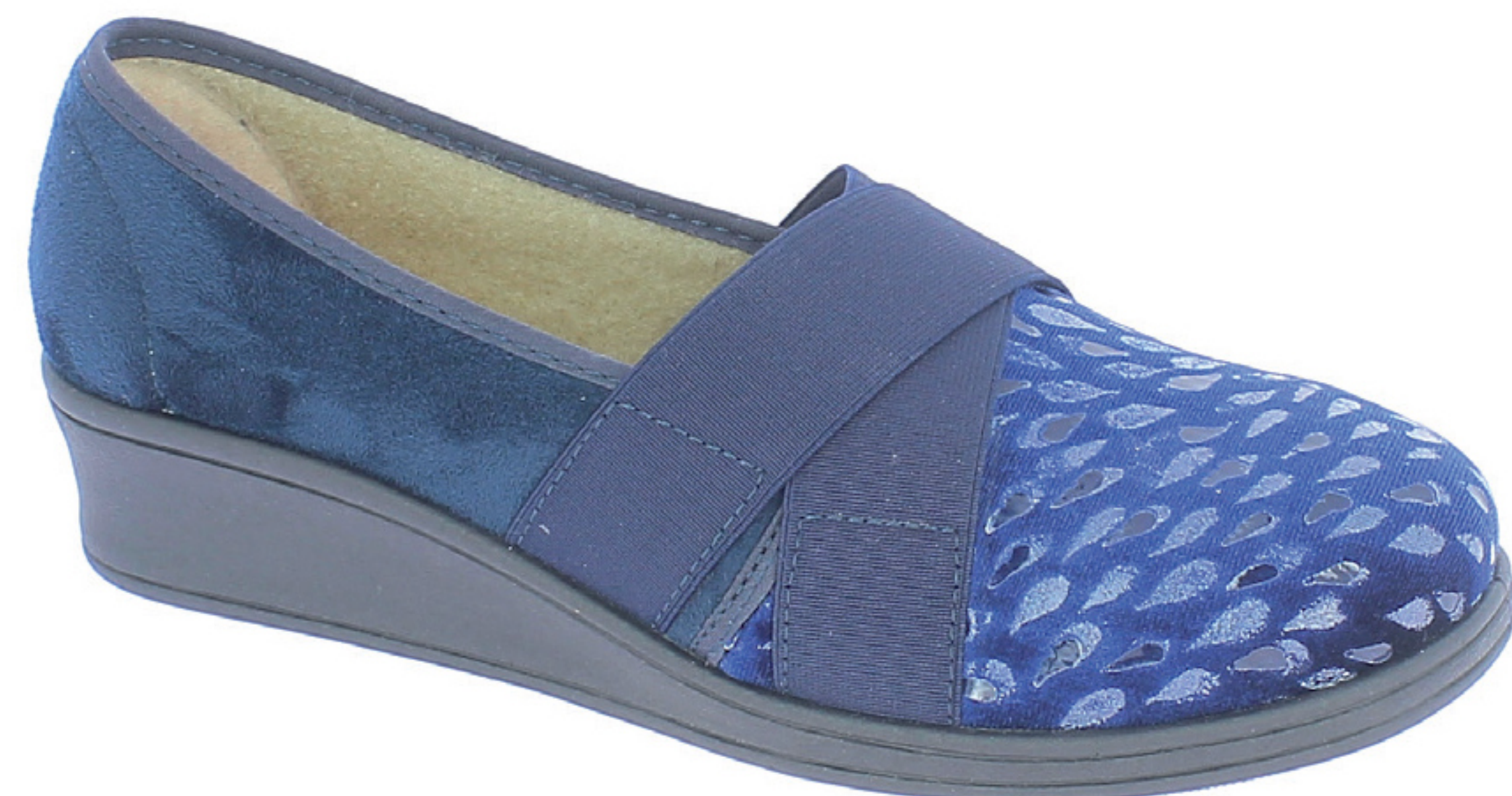
AGNESE COD. 562