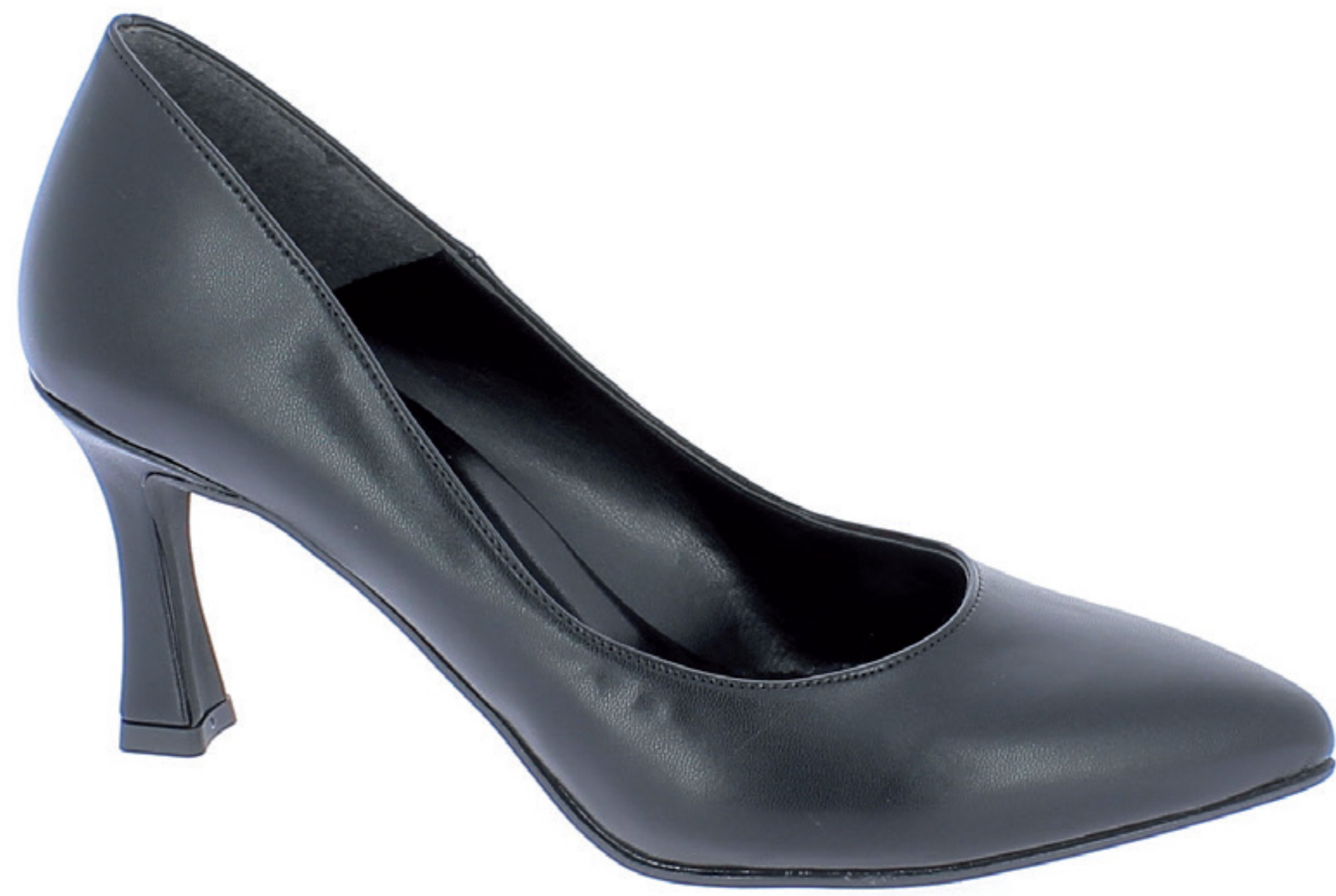
TECLA COD. 501