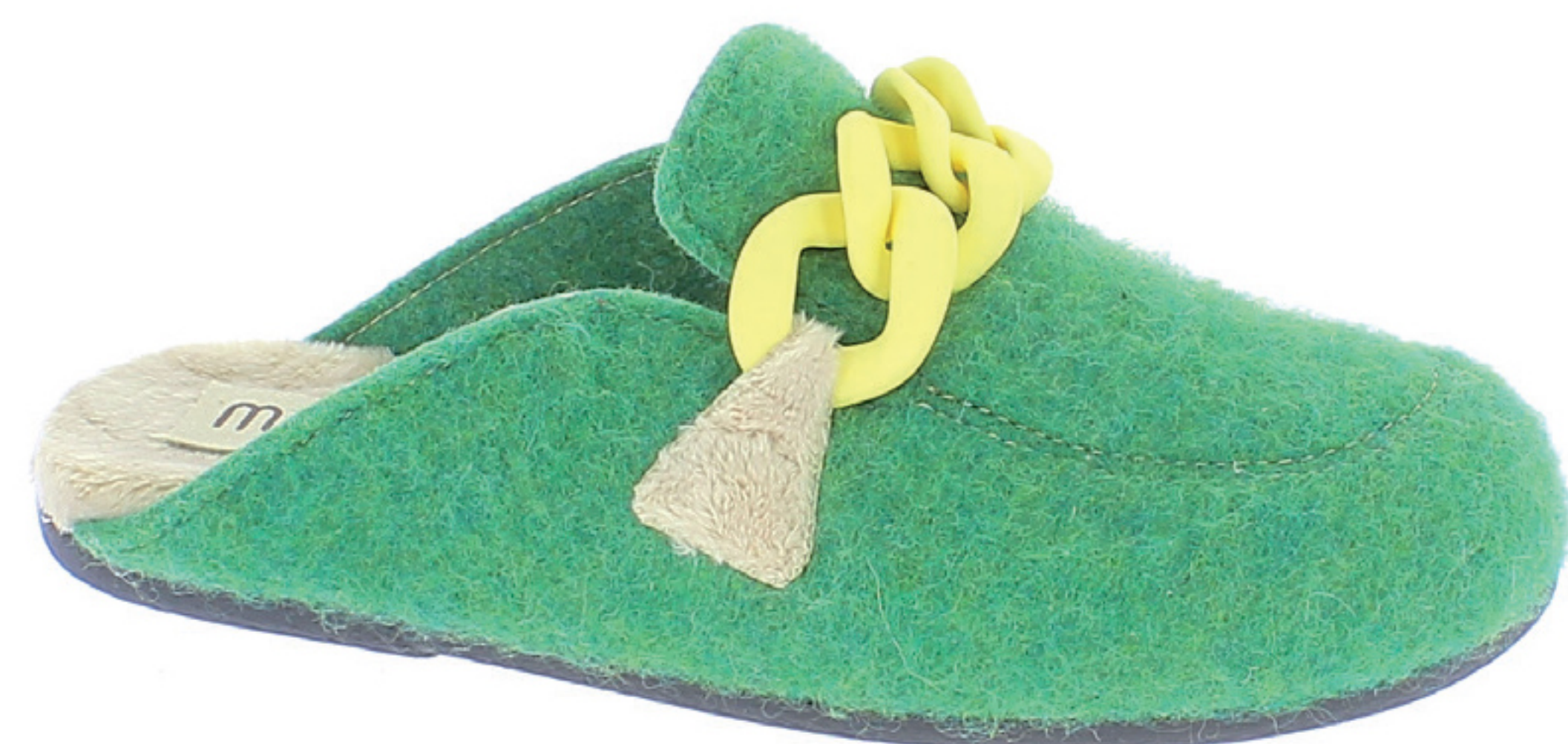
BETTA COD. 504