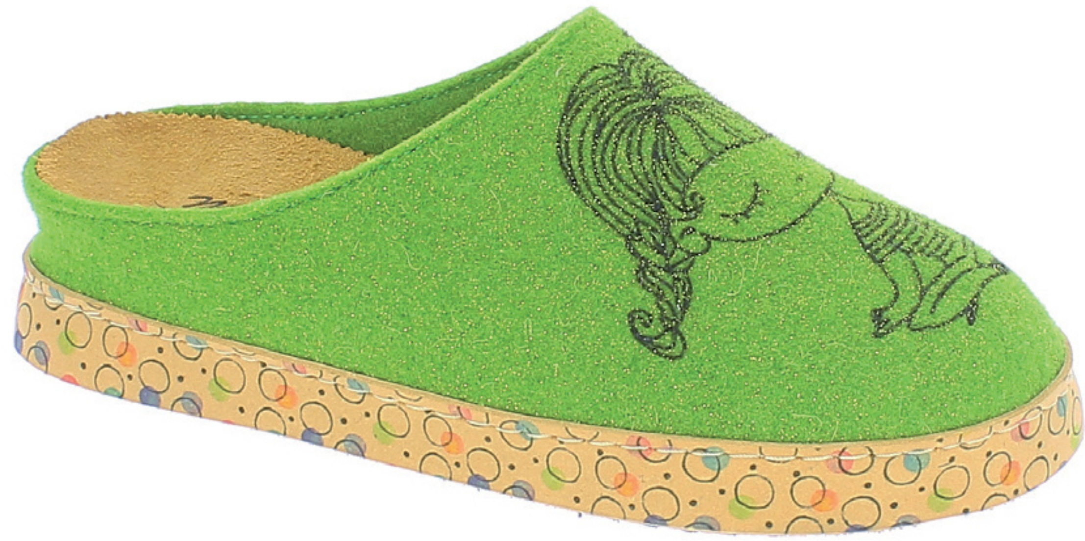
CAMILLA COD. 562