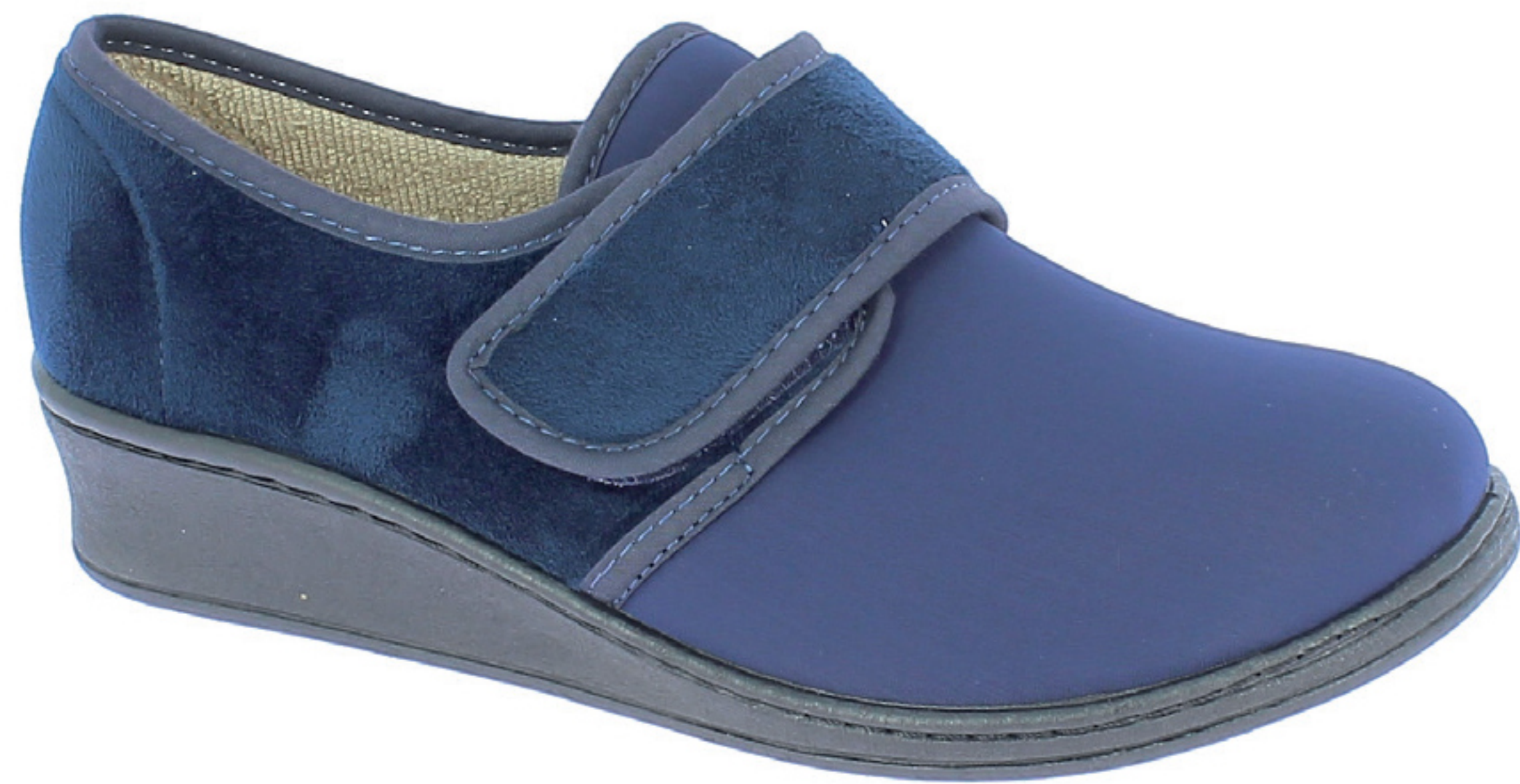
AGNESE COD. 500