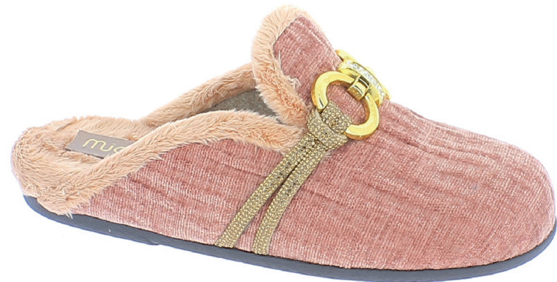
BETTA COD. 502