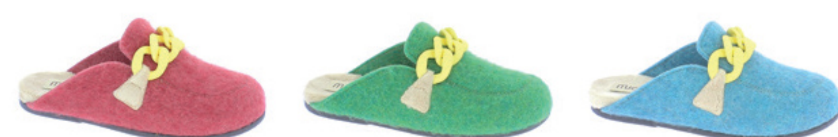
CORALLO SMERALDO TURCHESE