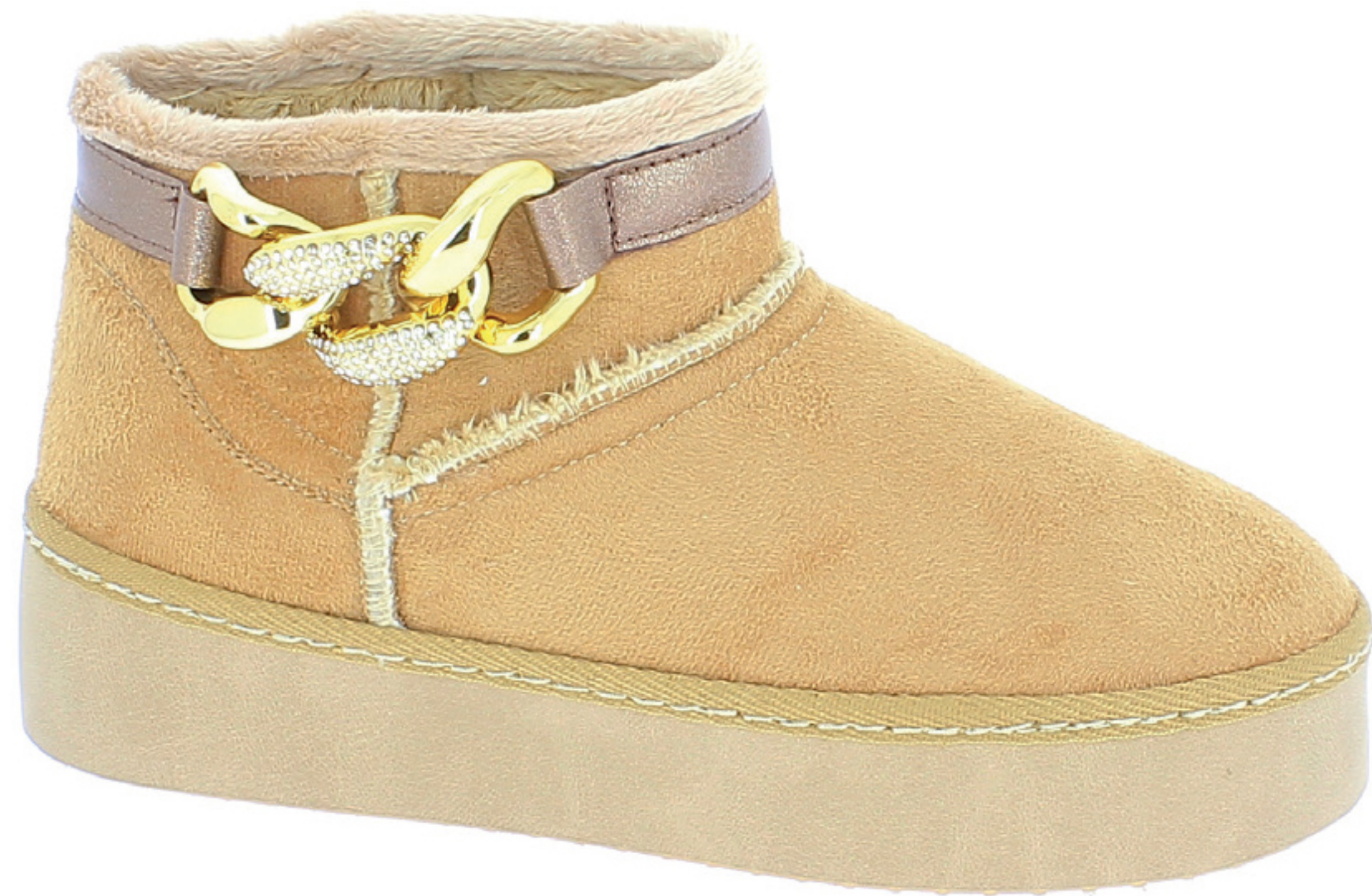
MYA COD. 502